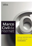
Marco Civil da Internet Atlas - 2014

Na obra intitulada "Direito Digital – Debates contemporâneos", é possível perceber o protagonismo feminino na abordagem das demandas que envolvem o Direito Digital em suas diversas nuances. Trata-se, portanto, de uma coletânea escrita por Mulheres que atuam na área do Direito Digital, demonstrando uma quebra de paradigma em um cenário aparentemente masculino.