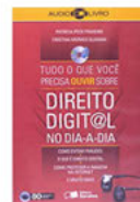
Tudo o que Você Precisa Saber Sobre Direito Digital no Dia a Dia (audiolivro) Saraiva - 2009

Quais são os perigos trazidos pela sociedade digital e como se proteger fazendo uso da tecnologia de forma segura, ética e legal, para uso pessoal ou profissional? Quais os cuidados que os pais devem tomar com seus filhos no uso da internet? E os próprios filhos? Tudo é permitido? Ou cada vez mais nossa reputação está on-line e em tempo real, ambiente em que a vida ficou digital, mas as consequências são bem reais?