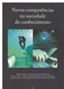
Novas competências na sociedade do conhecimento Edições Leitura Crítica - 2016

Este livro reúne os mais relevantes temas para a eficiente coleta de provas compreendendo desde o detalhamento sobre a coleta de evidências digitais, o rastreamento de manipulação de informações e de imagens na rede e, principalmente, o universo virtual escondido onde ocorre a maior parte dos crimes cibernéticos venda de armas, drogas, pedofilia, entre outros.