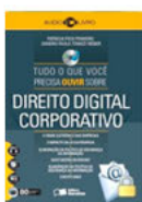
Direito Digital Corporativo (audiolivro) Saraiva - 2011

Analisa, de forma introdutória e geral, a maneira como o mundo jurídico responde aos novos desafios e aos problemas complexos de dimensão inédita. Reúne textos de prestigiados pesquisadores e professores que examinam a criação de "novos" direitos a partir de também novas demandas sociais. Direitos - individuais e coletivos - de minorias sociais e de populações vulneráveis são a principal preocupação dos autores. Trata-se de uma leitura crítica do papel do direito perante os conflitos sociais em constante transformação.