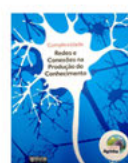
Redes e Conexões da Produção de Conhecimento Kairós Edições - 2014

Quais são os perigos trazidos pela sociedade digital e como se proteger fazendo uso da tecnologia de forma segura, ética e legal, para uso pessoal ou profissional? Quais os cuidados que os pais devem tomar com seus filhos no uso da internet? E os próprios filhos? Tudo é permitido? Ou cada vez mais nossa reputação está on-line e em tempo real, ambiente em que a vida ficou digital, mas as consequências são bem reais? sociais em constante transformação.