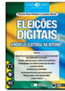
Eleições Digitais - a Nova Lei Eleitoral na Internet Saraiva - 2013

Conheça neste audiolivro os aspectos mais importantes sobre a segurança no ambiente digital de uma empresa: os riscos, os crimes eletrônicos, a proteção de dados, a questão do monitoramento. Dicas Preciosas sobre tecnologia da informação, as vantagens e as ameaças da Era Digital.