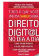
Tudo o que Você Precisa Saber Sobre Direito Digital no Dia a Dia (pocket book) Saraiva - 2009

A internet já se firmou como um veículo natural para a obtenção de informações sobre governos, partidos e, principalmente, para consolidar a imagem política dos candidatos. Ela torna o exercício de cidadania mais interativo, aumenta o acesso a informações para um eleitorado cada dia mais conectado, possibilitando o engajamento cívico e o debate político em tempo real.