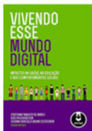
Vivendo esse mundo digital Artmed - 2013

O Marco Civil da Internet é uma lei que vem sendo chamada de "a Constituição da Internet". A razão para isso é tanto sua importância substantiva, no sentido de estabelecer os direitos, princípios e deveres no uso da Internet no Brasil, quanto a forma