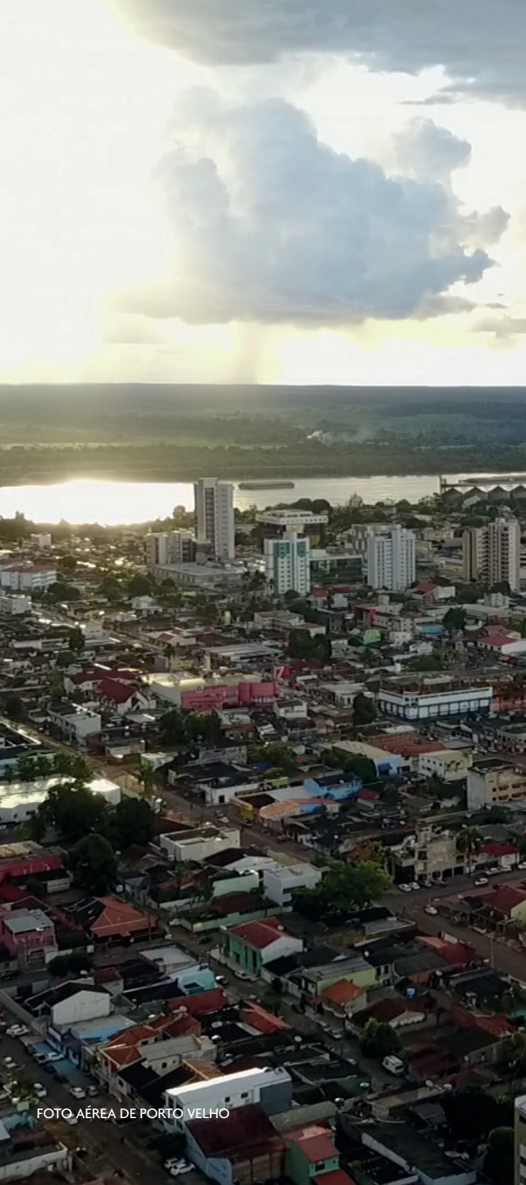
FOTO AÉREA DE PORTO VELHO