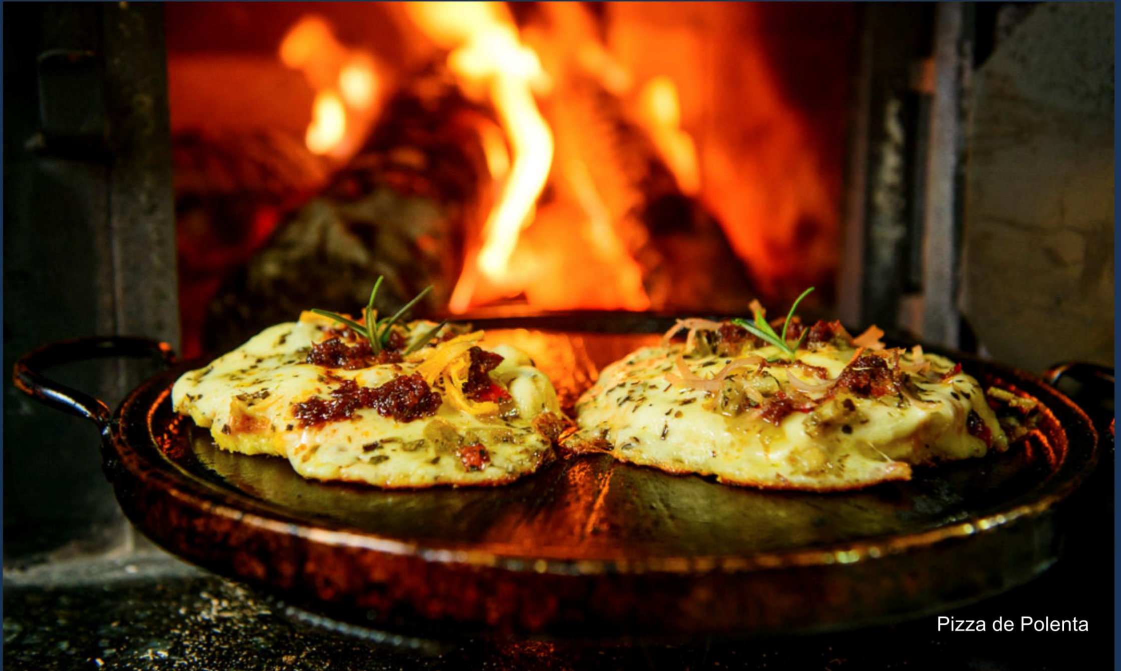
Pizza de Polenta