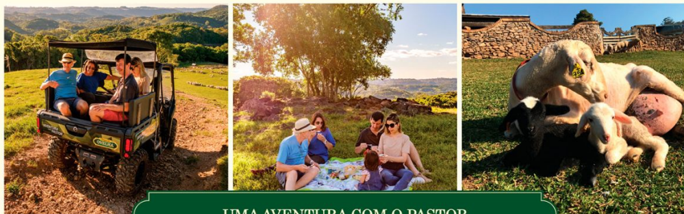
UMA AVENTURA COM O PASTOR

Essa aventura te leva por toda a extensão de pastagens da fazenda, e você ainda conhece com exclusividade o nosso berçário! Lá você irá encontrar cordeiros recém-nascidos, com pouquíssimos dias de vida e receberão todas as informações desde a gestação da mãe, até o nascimento e o bem-estar do cordeirinho.