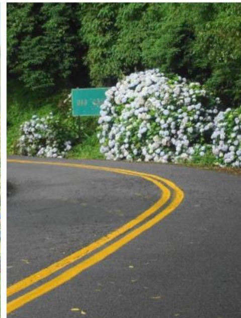
Estrada da Graciosa