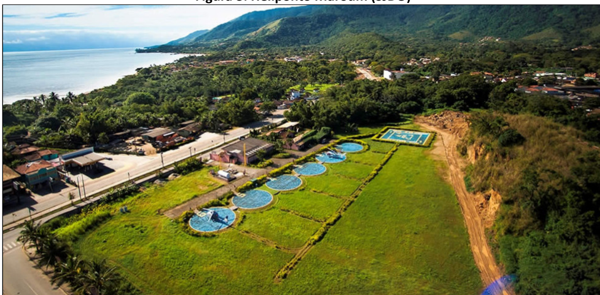
Figura 3: Heliponto Maroum (SJDO)