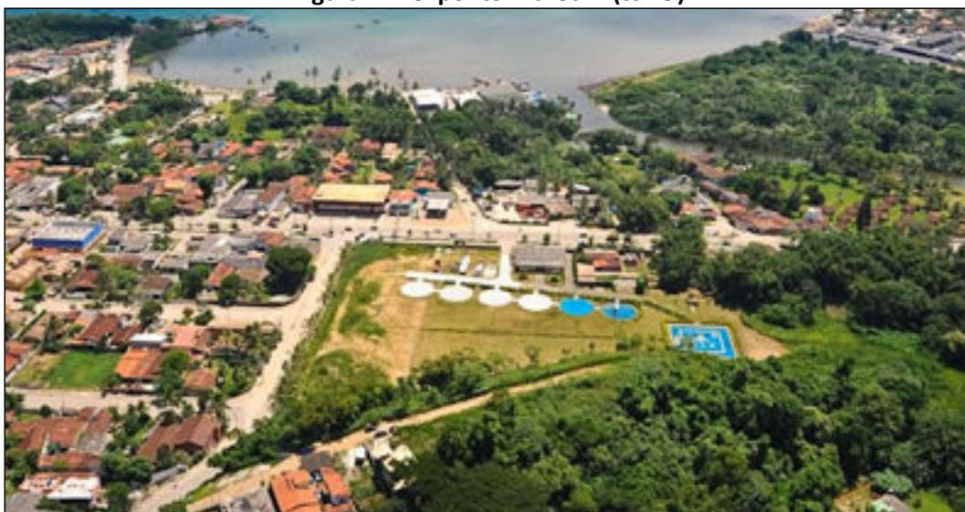
Figura 4: Heliponto Maroum (SJDO)