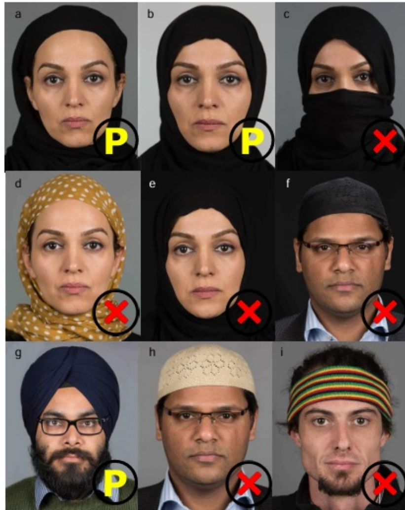
Figure 31 — a), b) Compliance depends on issuer policy, c) Face not completely visible, d) Non-uniform head covering, e), f) Low background contrast, g) Compliance depends on issuer policy, h) Visible perforation, i) Non-religious head coverage.

An issuer may or may not require that the ears are visible. The capture process should minimize shadows and obscuration of features in the facial region. This might involve adjustment of the head coverings. See Figure 31.