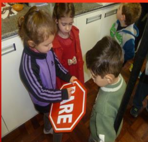
IDENTIFICANDO PLACAS DE TRÂNSITO