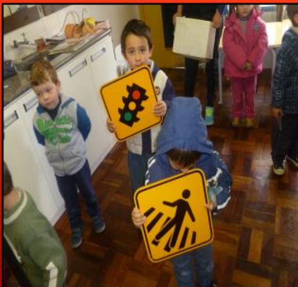
ATIVIDADES COM AS PLACAS