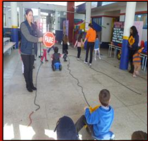
ATIVIDADES COM AS PLACAS