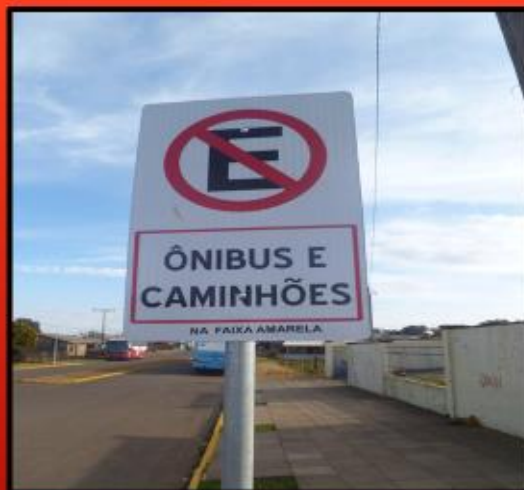
SINALIZAÇÃO EXISTENTE NAS PROXIMIDADES

- Identificação de situação e risco nas proximidades da escola.