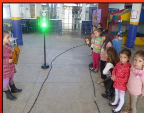
ATIVIDADES DE ORIENTAÇÃO UTILIZANDO PLACAS E SEMÁFORO