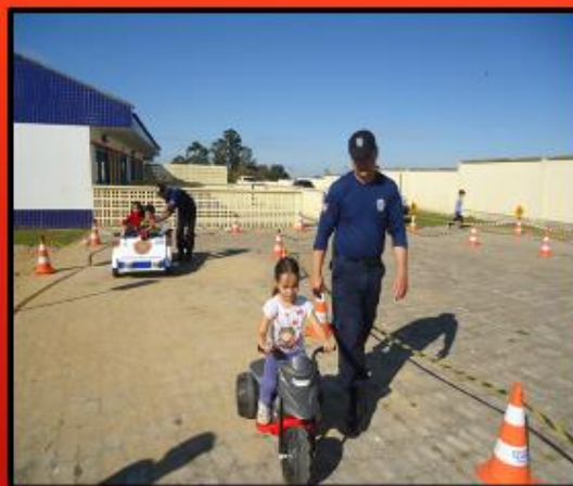
A GUARDA MUNICIPAL REALIZOU ORIENTAÇÃO AOS ALUNOS