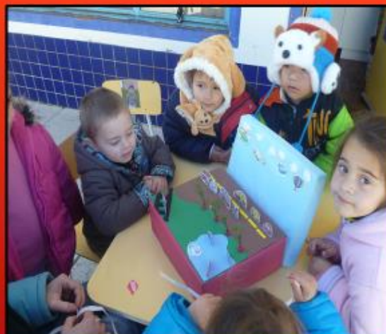
CONFECÇÃO DE MAQUETE