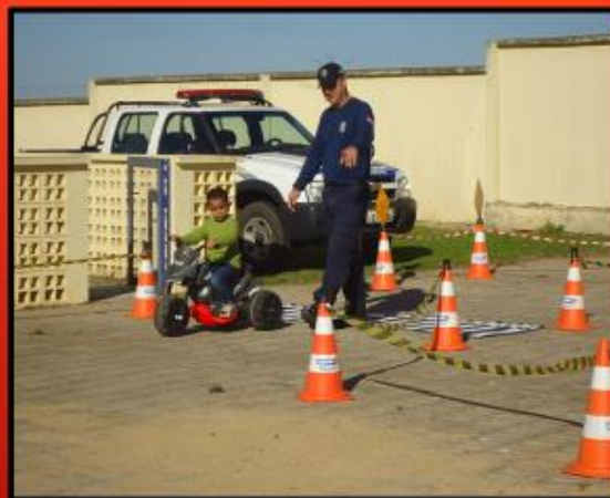
A GUARDA MUNICIPAL REALIZOU ORIENTAÇÃO AOS ALUNOS