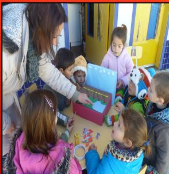
CONFECÇÃO DE MAQUETE

Posteriormente elaboraram em conjunto uma maquete posicionando cada imagem de transporte no lugar correto.