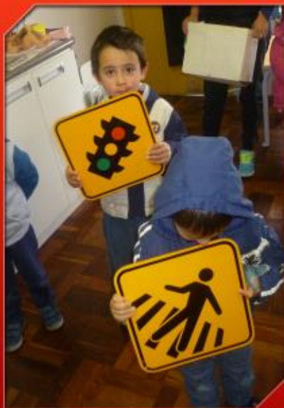
IDENTIFICANDO PLACAS DE TRÂNSITO

Foram apresentadas aos alunos diversas placas de trânsito para os mesmos manusearem e realizarem conversação, demonstrando o conhecimento que cada um tem sobre as placas.