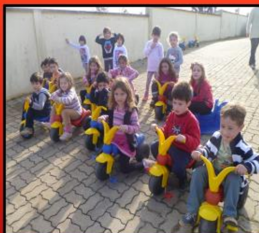
ATIVIDADES DE ORIENTAÇÃO COM AS MOTOCAS