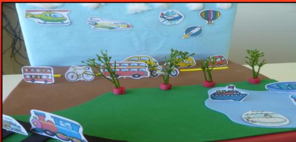
IDENTIFICANDO OS TIPOS DE TRANSPORTES

Foram distribuídas diversas imagens aos alunos e realizada uma conversação sobre os tipos de transportes (terrestre, aéreo e aquático).