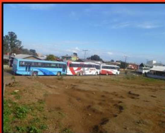
SITUAÇÃO DE RISCO: EMPRESA DE TRANSPORTE AO LADO DA ESCOLA