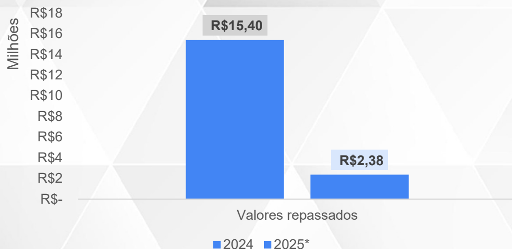
Valore repassados IGD-M - Sergipe