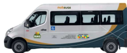
Veículo tipo Van