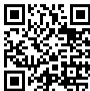
Blog do FNAS