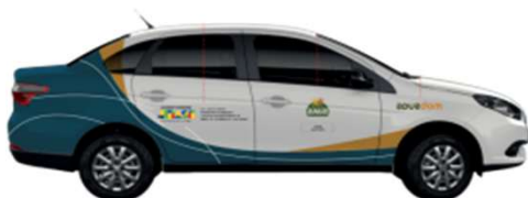
Veículo de passeio