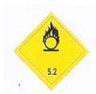
(Nº 5.2) CLASSE 5.2 - PEROXÍDOS ORGÂNICOS Símbolo - chama sobre círculo em preto Fundo amarelo número 5.2 no canto inferior