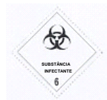
(Nº 6.2) CLASSE 6.2 - SUBSTÂNCIAS INFECTANTES A metade inferior da etiqueta deve ter a inscrição SUBSTÂNCIA INFECTANTE e em caso de dano ou vazamento comunicar imediatamente a autoridade de saúde pública. Símbolo: três meias-luas crescentes superpostos em um círculo e inscrições em preto Fundo branco número 6 no canto inferior