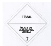
(Nº 7E) Fundo Branco Texto (obrigatório) em preto na parte superior da etiqueta escrito: FÍSSIL . Na metade inferior da etiqueta, num retângulo em preto: ÍNDICE DE SEGURANÇA CRÍTICA . número 7 no canto inferior