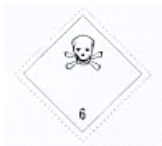
(Nº 6.1) CLASSE 6.1 - SUBSTÂNCIAS TÓXICAS Símbolo - caveira em preto Fundo branco número 6 no canto inferior