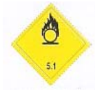
(Nº 5.1) CLASSE 5.1 - SUBSTÂNCIAS OXIDANTES Símbolo - chama sobre círculo em preto Fundo amarelo número 5.1 no canto inferior