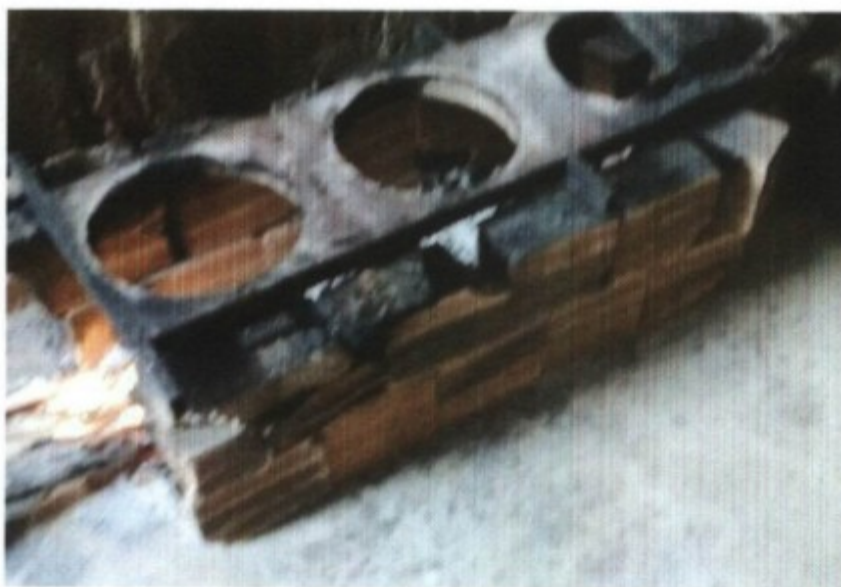
Foto 05. Fogareiro improvisado no piso da casa.

Como não havia instalação sanitária disponível no local, as necessidades fisiológicas eram realizadas de maneira improvisada, no mato