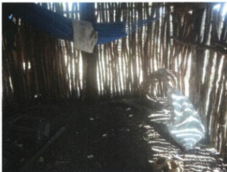
Foto 03. Um dos trabalhadores dormia em um local destinado à acomodação de caprinos, onde o piso estava coberto de fezes destes animais.

As refeições servidas aos trabalhadores eram preparadas ao relento, no chão, em um fogareiro improvisado com pedras, sem o cumprimento das exigências básicas de higiene necessárias, e tomadas sem o mínimo de conforto exigido, conforme demonstram as fotos seguintes. Desobedecendo aos itens seguintes da NR 31: