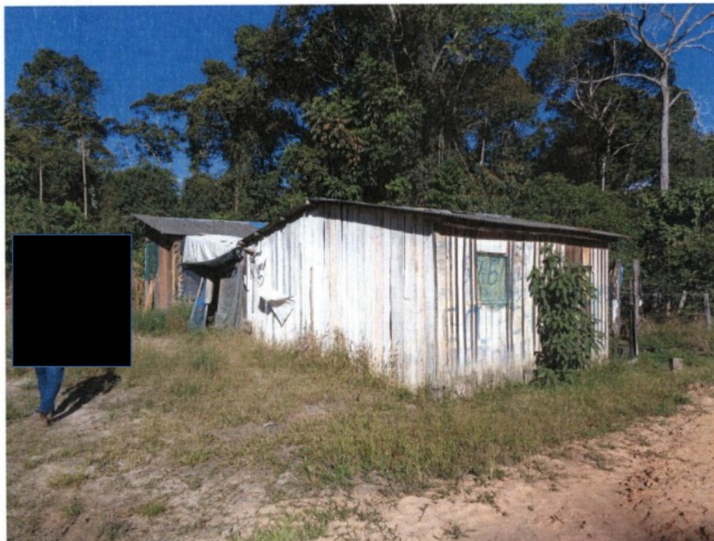
Fig.: habitação abandonada.

Em ação fiscal do Grupo Especial de Fiscalização Móvel - GEFM, constituído por Auditores Fiscais do Ministério do Trabalho e Emprego, representante do Ministério Público do Trabalho, representante da Defensoria Pública da União e Policiais Rodoviários Federais, iniciada em 01/07/2015, na Fazenda Santa Inês, não constatamos a presença de trabalhadores em atividade de catação de raiz. Constatamos que na propriedade havia uma habitação abandonada ao lado de um rio, com indícios de que houve trabalhadores alojados. (foto abaixo).