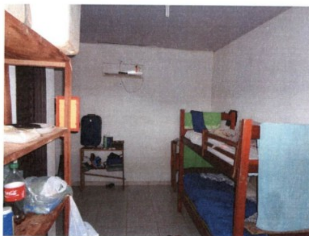
Alojamento de trabalhadores..