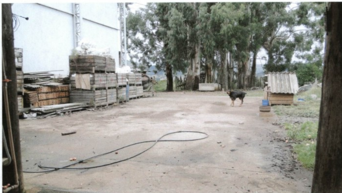
A guarda de agrotóxicos e as embalagens vazias ficavam em local muito próximo ao canil de um cachorro, expondo-o à intoxicação pelo conteúdo dos produtos