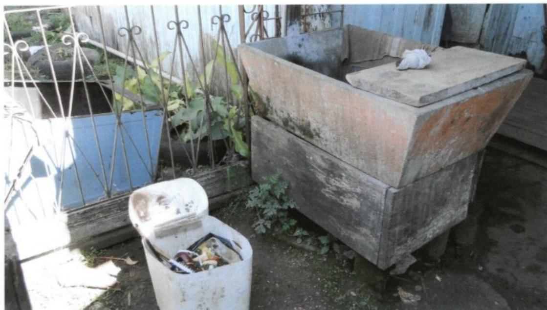
Acima tanque logo na entrada do alojamento, abaixo a porta do alojamento