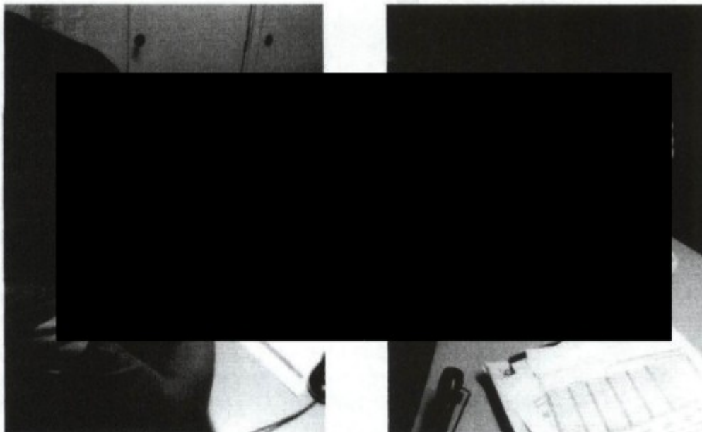
Momento do pagamento e assinatura do Termo de Rescisão do Contrato de Trabalho do trabalhador estrangeiro em situação irregular no país.