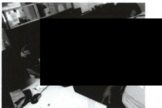
Trabalhador recebendo suas verbas rescisórias.