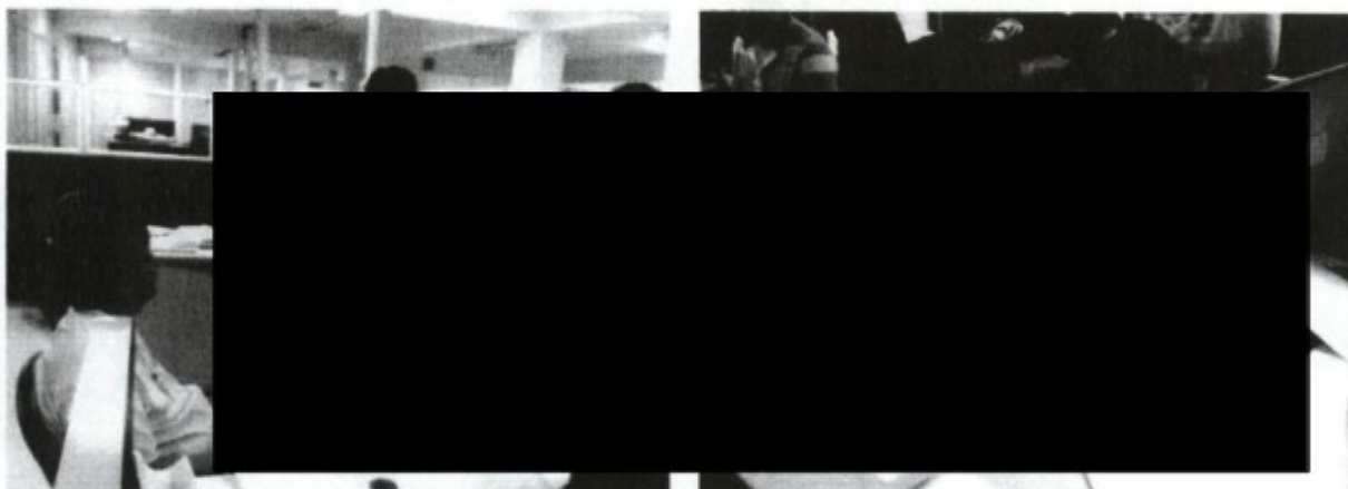
Momento do pagamento e assinatura do Termo de Rescisão do Contrato de Trabalho do trabalhador estrangeiro em situação irregular no país.