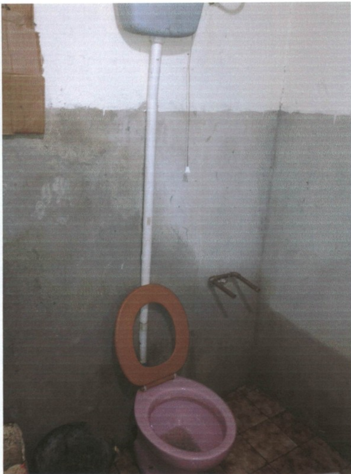
Aspecto do sanitário externo. Banheiro sem pintura. GTX.