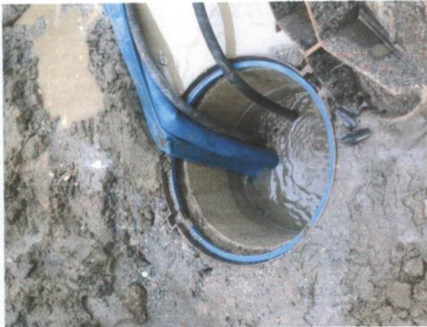
Cor das águas da rede pluvial.

A partir da situação concreta, foram entrevistados trabalhadores e a seguinte colocação foi feita em reunião: