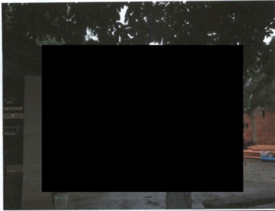
Alojamento usado pela GTX.