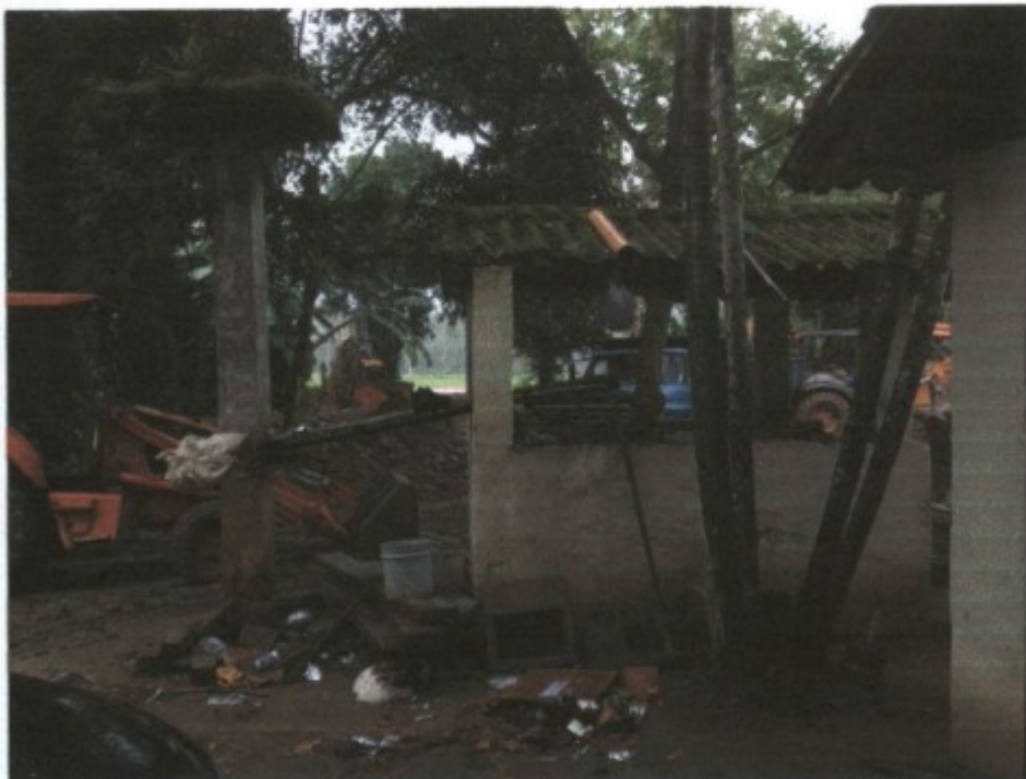
Sujeira no entrono do alojamento da GTX.