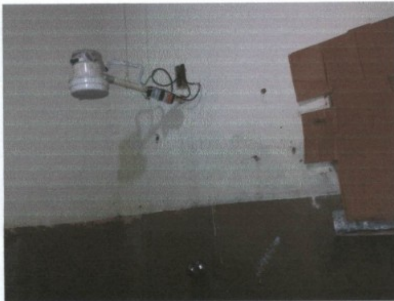
Chuveiro externo com fiação aparente.

O alojamento da empresa GTX CONSTRUÇÕES e comércio ltda - ME , CNPJ 15049409-0001/70 se situa na Estrada Paraty Cunha S/N, Portal Vermelho. Os trabalhadores [REDACTED] manifestaram a vontade de retornar aos seus estados (SP e AL). Outros 13 já haviam retornado fazia uma semana.