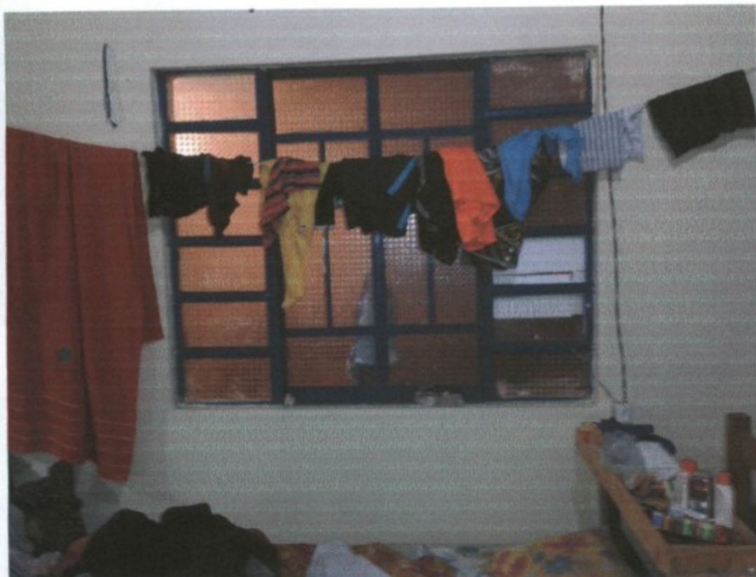
Falta de armários no alojamento da GTX.