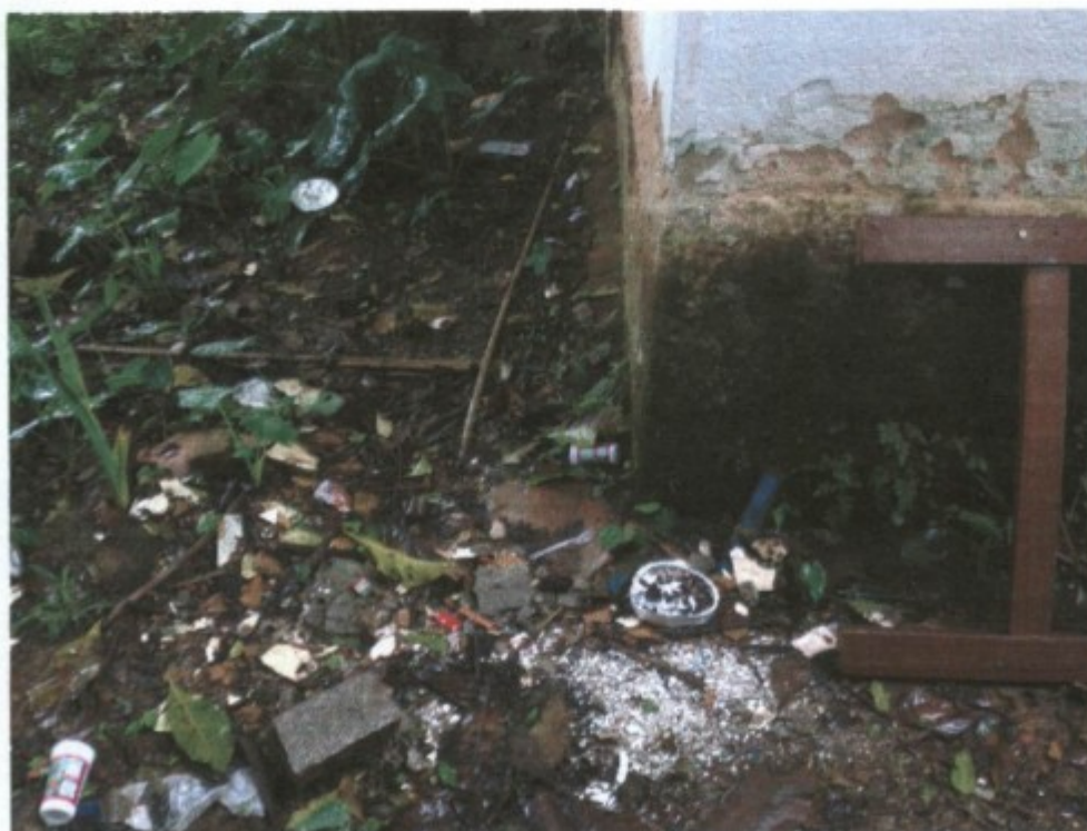
Lixo nas imediações da casa usada pela GTX.