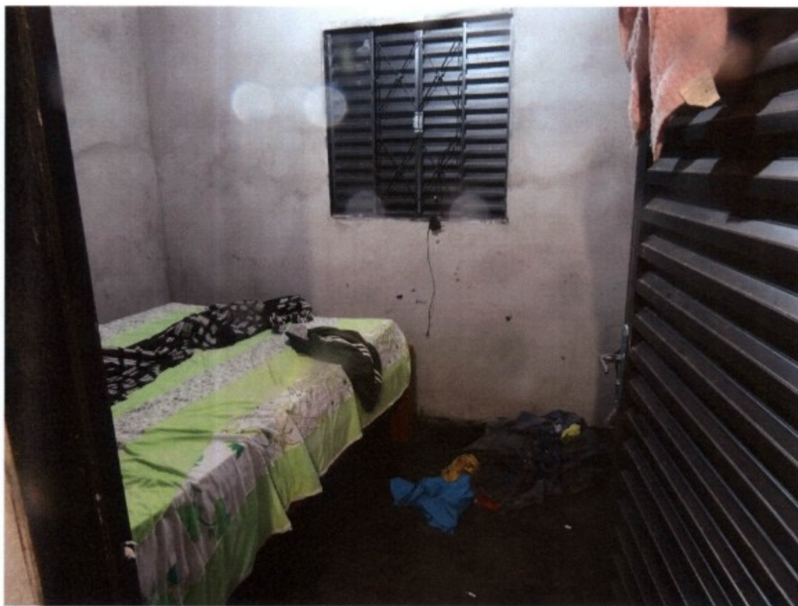
Foto: alojamento com roupas espalhadas pelo chão por falta de armário.