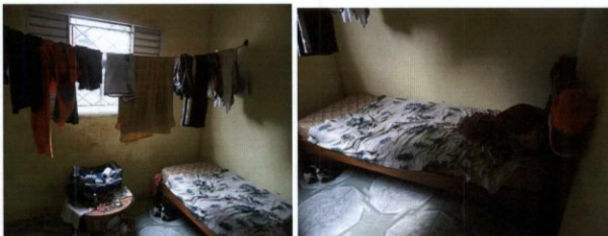
Fig.: Quartos dos trabalhadores.

Após a entrevista o grupo realizou verificação física no alojamento e verificou que os trabalhadores estavam alojados em uma casa de material sem armários, coberta com telha de barro, e piso de cimento, que havia instalações sanitárias adequadas, local para tomar as refeições e cozinha com fogão e energia elétrica. A água era coletada de uma cisterna e bombeada para a caixa d'água. Os vasos sanitários e os chuveiros estavam em perfeitas condições de uso.