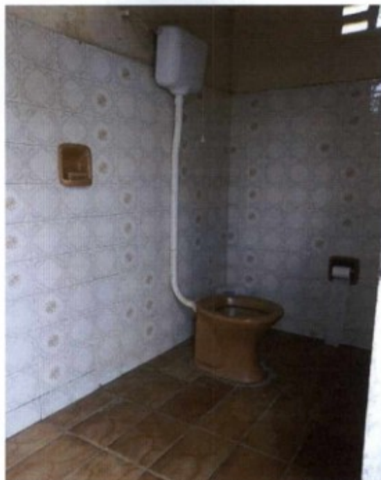
Fig.: Banheiro disponibilizado aos trabalhadores.