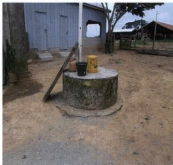
Fig.: Local de coleta de água para consumo.

Não constatadas as irregularidades descritas na denúncia, a equipe deu por encerrada a fiscalização, deslocando-se em seguida para outra localidade com o fito de averiguar mais uma denúncia.