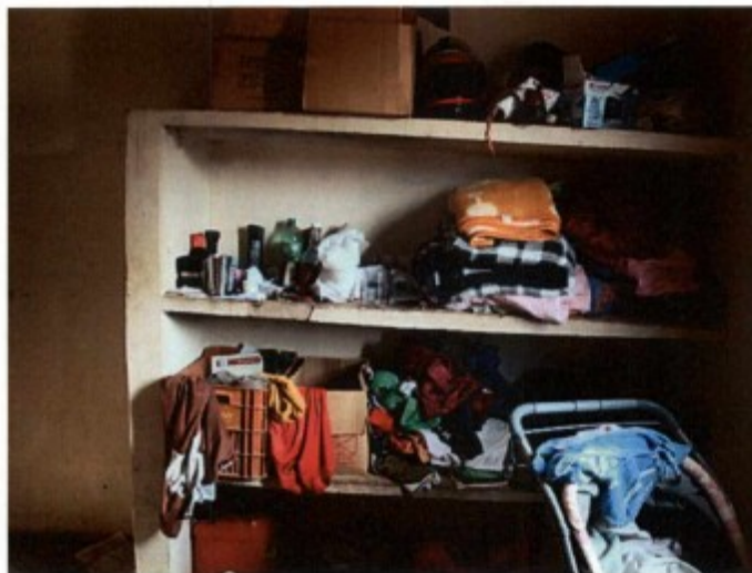
Fotos 2,3,4 e 5 vista do interior da casa dos vaqueiros.