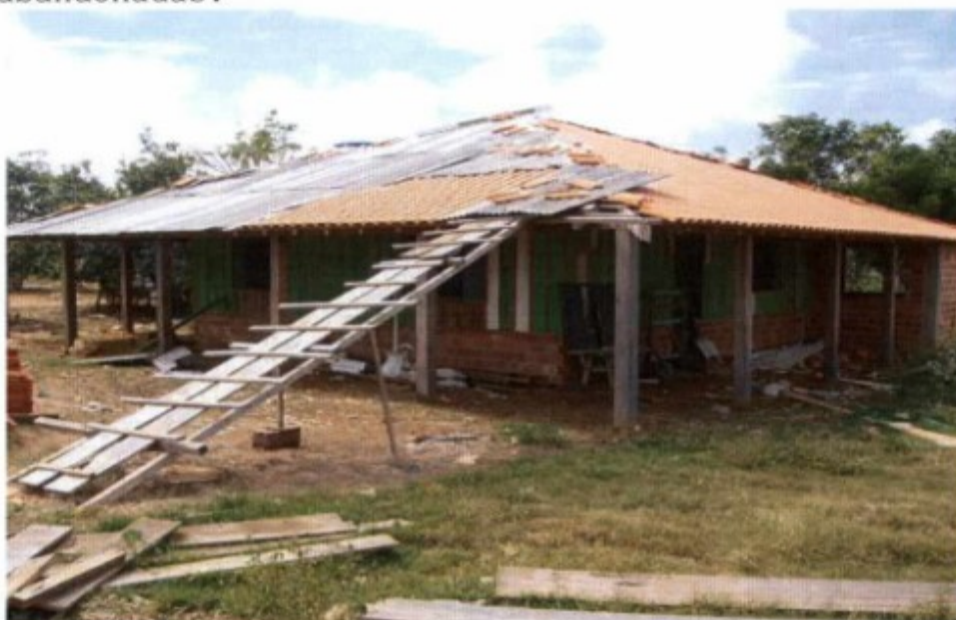
Fig.: Obra em reforma na fazenda Recria.

Em ação fiscal do Grupo Especial de Combate ao Trabalho Escravo - GEFM, constituído por Auditores Fiscais do Ministério do Trabalho e Emprego, representante do Ministério Público do Trabalho e Policiais Civis do Grupo de Operações Especiais - GOE do Estado do Mato Grosso, realizada em 04/7/2013 na fazenda RECRIA, localizada na zona rural do município de Rondolândia-MT, foi realizada verificação física nas instalações da fazenda e não foi constatada existência de nenhum trabalhador. De fato as instalações aparentavam ter estado em obras de reforma, mas foram abandonadas.