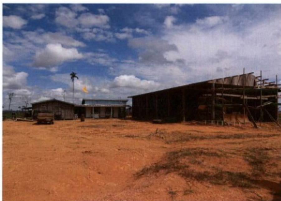
Fig.: Instalações da fazenda.