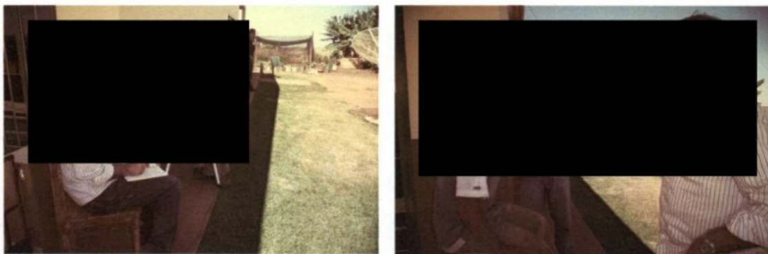
Fotos 03 e 04: Entrevistas realizadas com os trabalhadores pelo GEFM.

Foi realizada inspeção no alojamento, instalações sanitárias, cozinha, refeitório e o galpão que servia para guarda de máquinas e equipamentos agrícolas.