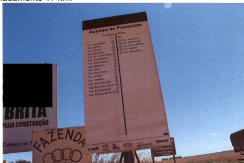
Foto 01: Placa com indicação da Fazenda Terra Nova na margem esquerda da BA 225.

Piauí. Aproximadamente 16 km depois de Formosa do Rio Preto/BA, entramos à esquerda no trevo que dá acesso à Rodovia BA 225. Seguimos por esta rodovia estadual por cerca de 72 km, quando dobramos à esquerda e entramos na estrada vicinal que dá acesso à fazenda Terra Nova, conforme indicação da placa registrada pela foto abaixo. A distância dessa entrada até a Fazenda Terra Nova é de aproximadamente 17 km.