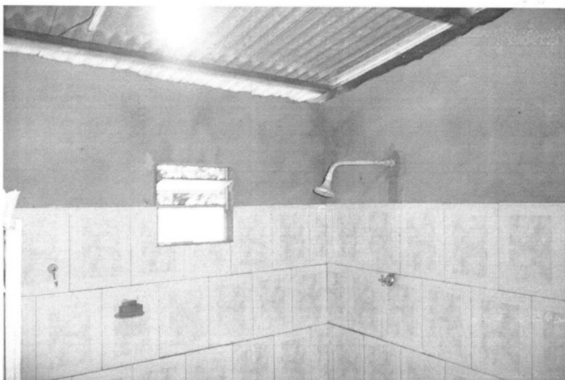
Fig. 1 e 2 – Banheiro utilizado pelos empregados