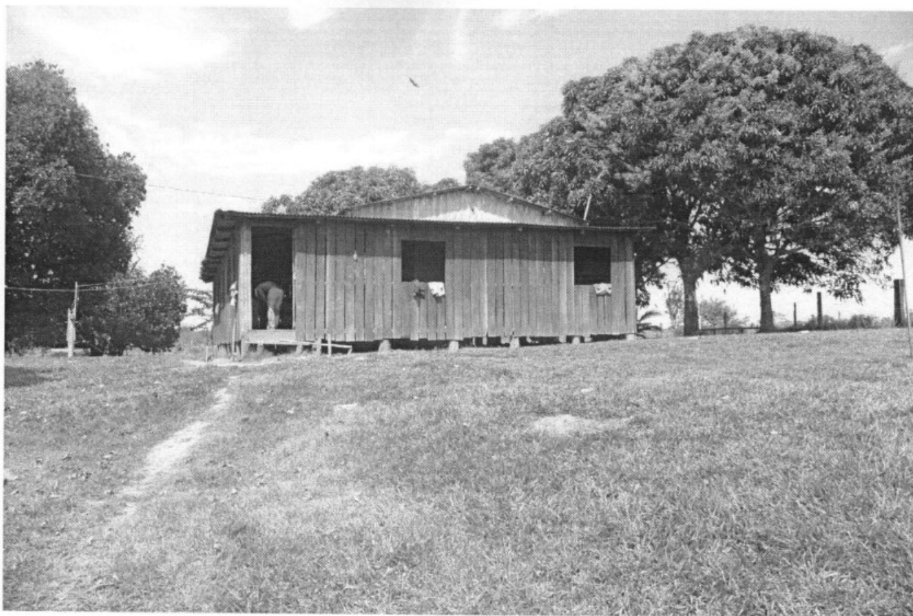
Fig. 3 – Alojamento dos empregados

Ministério do Trabalho e Emprego Sistema Federal de Inspeção do Trabalho Superintendência Regional do Trabalho e Emprego do Acre Rua Marechal Deodoro, 257, Centro, Rio Branco/AC