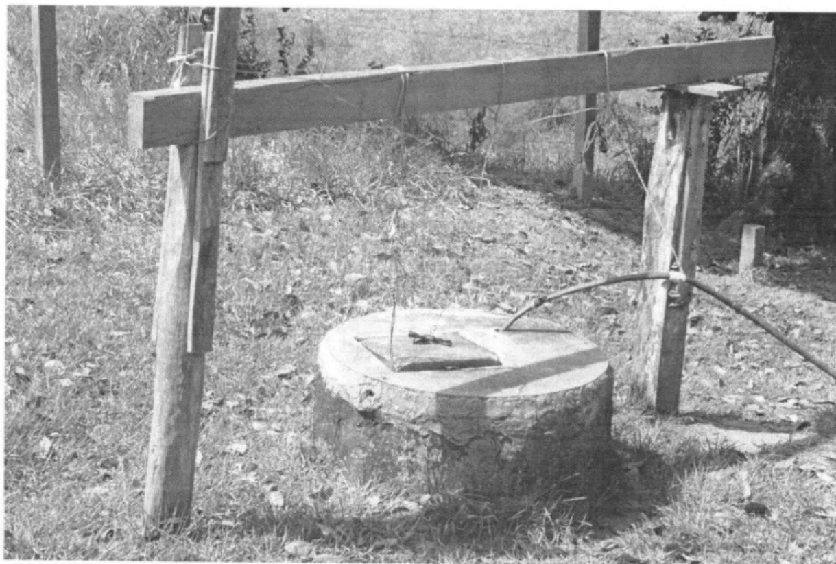
Fig. 4: Local onde é captada a água consumida pelos empregados.