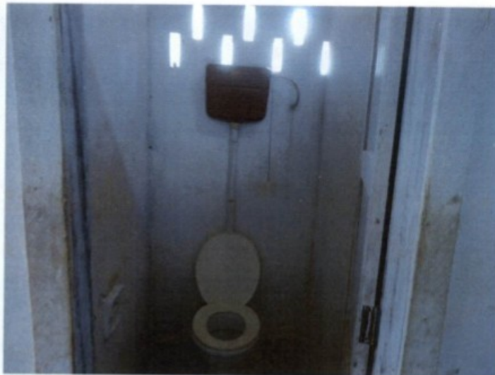
Torneiras e área de higienização (esq) e sanitário disponível aos trabalhadores (dir)

A empresa comprovou ter realizado os treinamentos de segurança devidos a seus obreiros, bem como lhes entregue os necessários equipamentos de proteção individual. Não foram constatadas situações de risco grave ou iminente nas linhas de desdobramento de madeira.