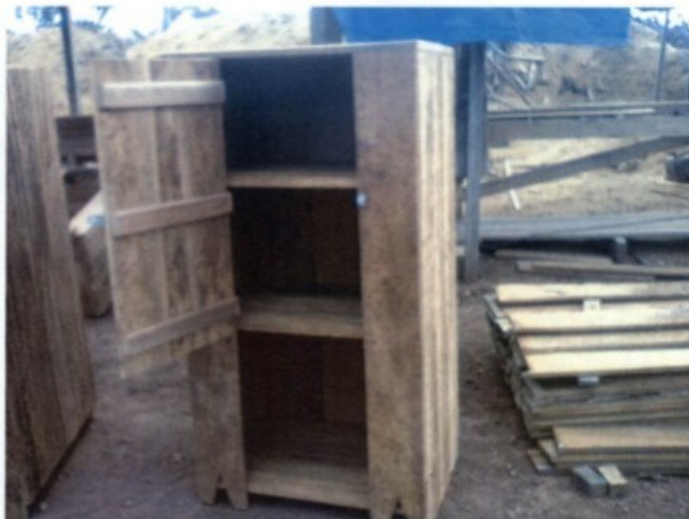
Esq: janela aberta no local de alojamento para ventilação. Dir: Armário individual construído pela empresa.

Ao final da atividade de fiscalização realizamos as anotações pertinentes no livro de inspeção do trabalho, registrando as irregularidades constatadas.