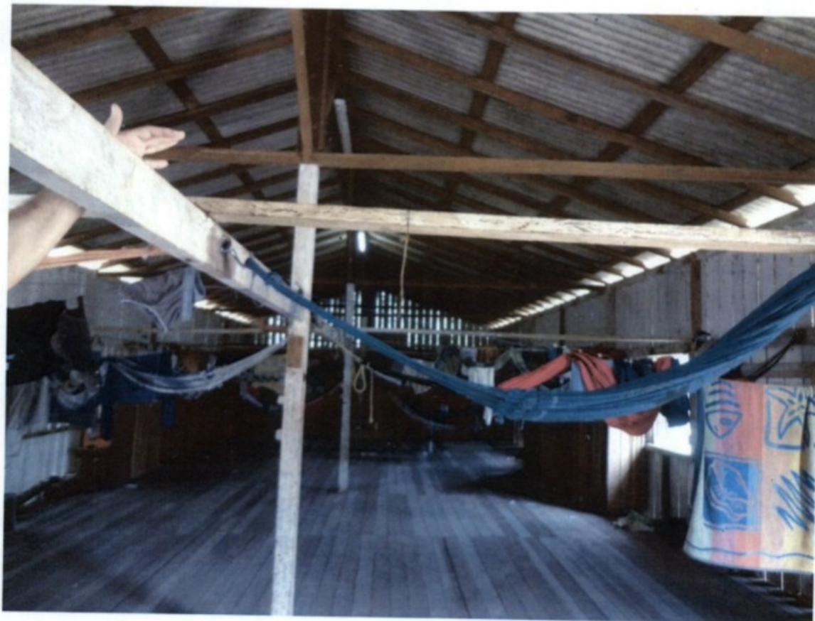
Alojamento da serraria

Havia no estabelecimento 43 trabalhadores ativos em atividades ligadas ao desdobramento de madeira. Verificamos que durante o período em que permanecem na empresa os empregados são alojados em ambiente que apresenta condições satisfatórias de habitabilidade.