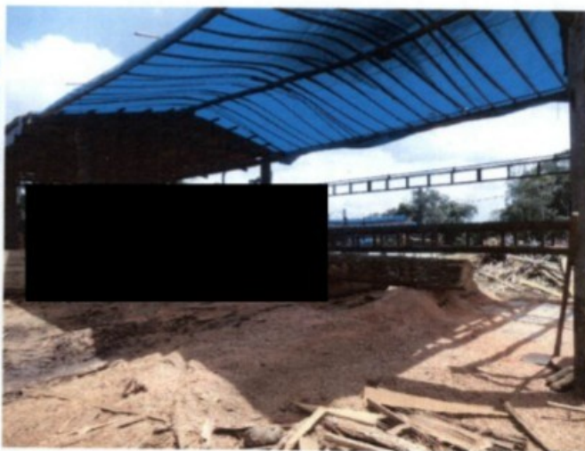
Esq: trabalhadores entrevistados receberam treinamentos de segurança e equipamentos de proteção individual. Dir: visão geral de área de desdobramento de madeira

Não foram encontrados trabalhadores em condições análogas às de escravo no curso da fiscalização ora relatada.