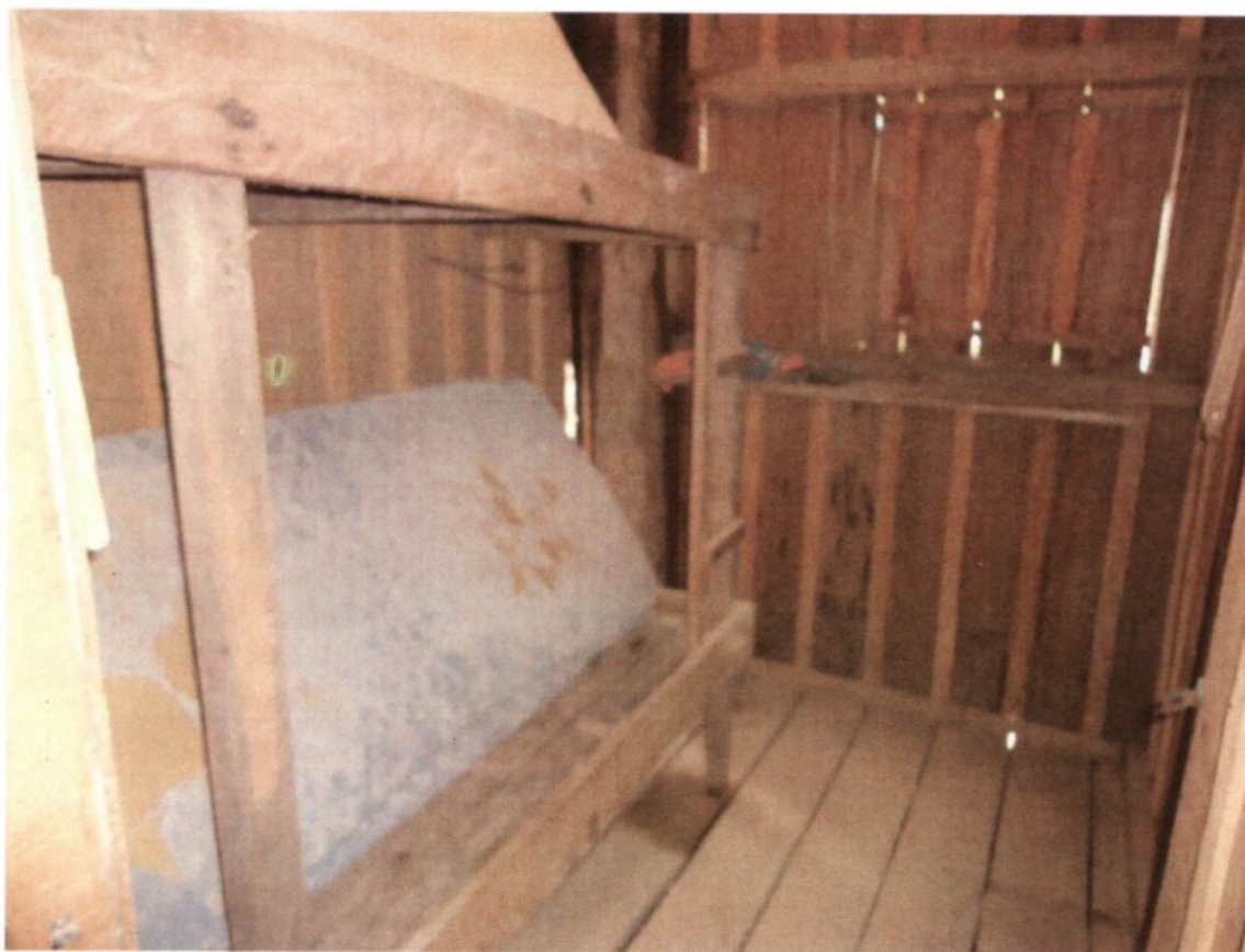
Foto de um dos quartos do alojamento.