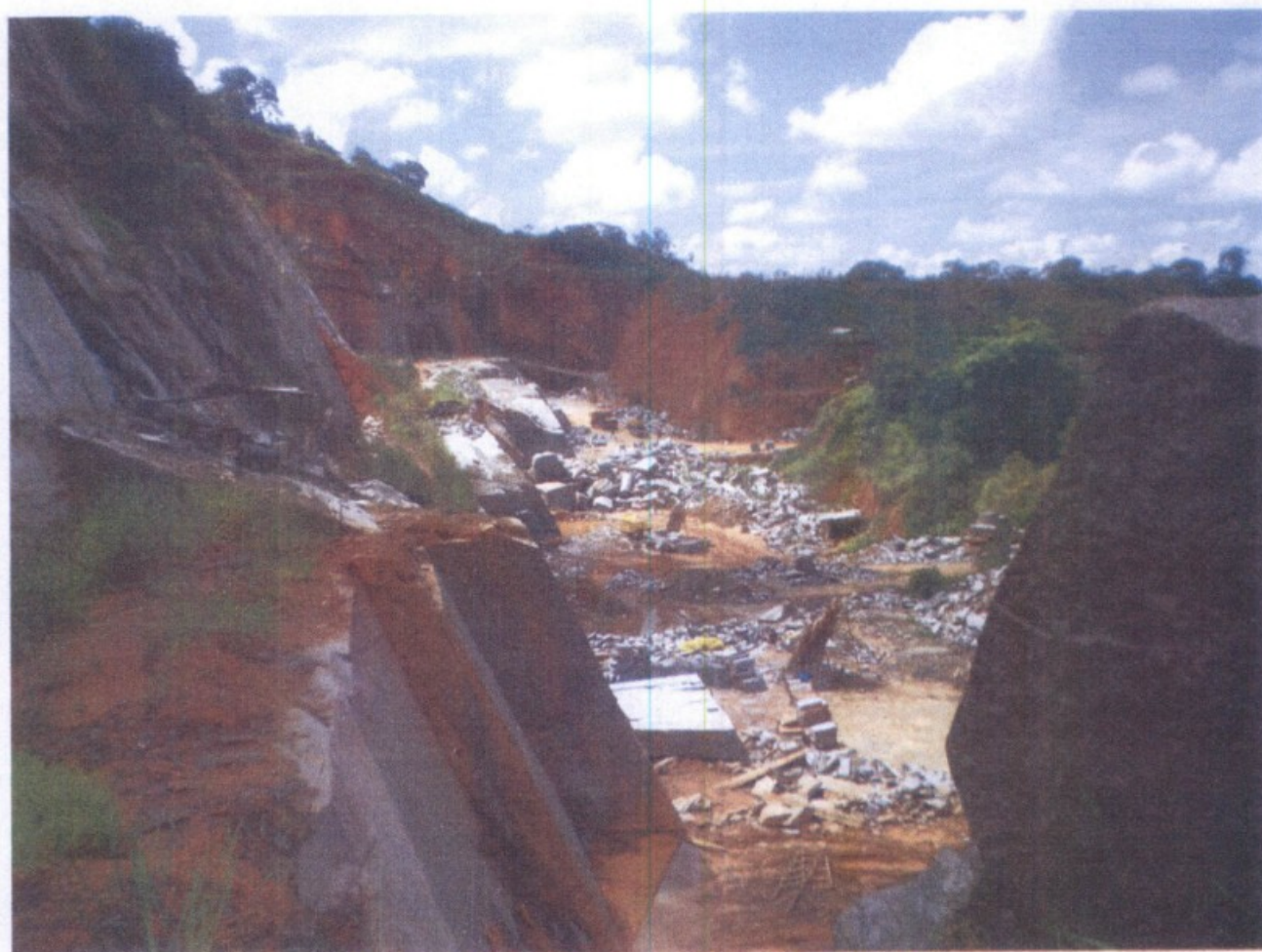
Vista da área de extração de pedras gnaisse

Em relação ao ambiente de trabalho na área de extração de pedra bruta, a fiscalização encontrou irregularidades, a seguir listadas.