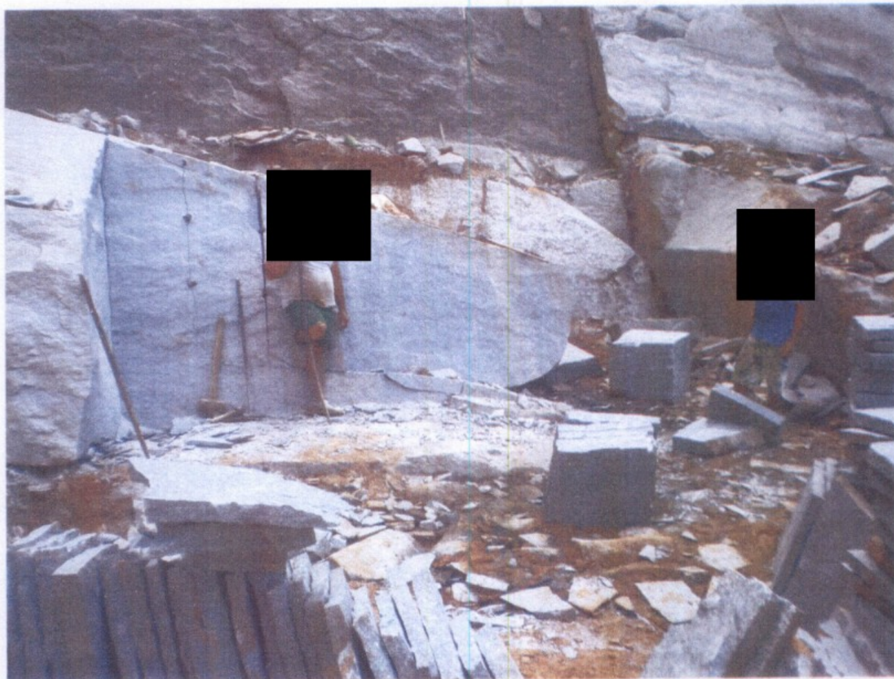
Empregado na atividade extrativa sem o uso de EPI