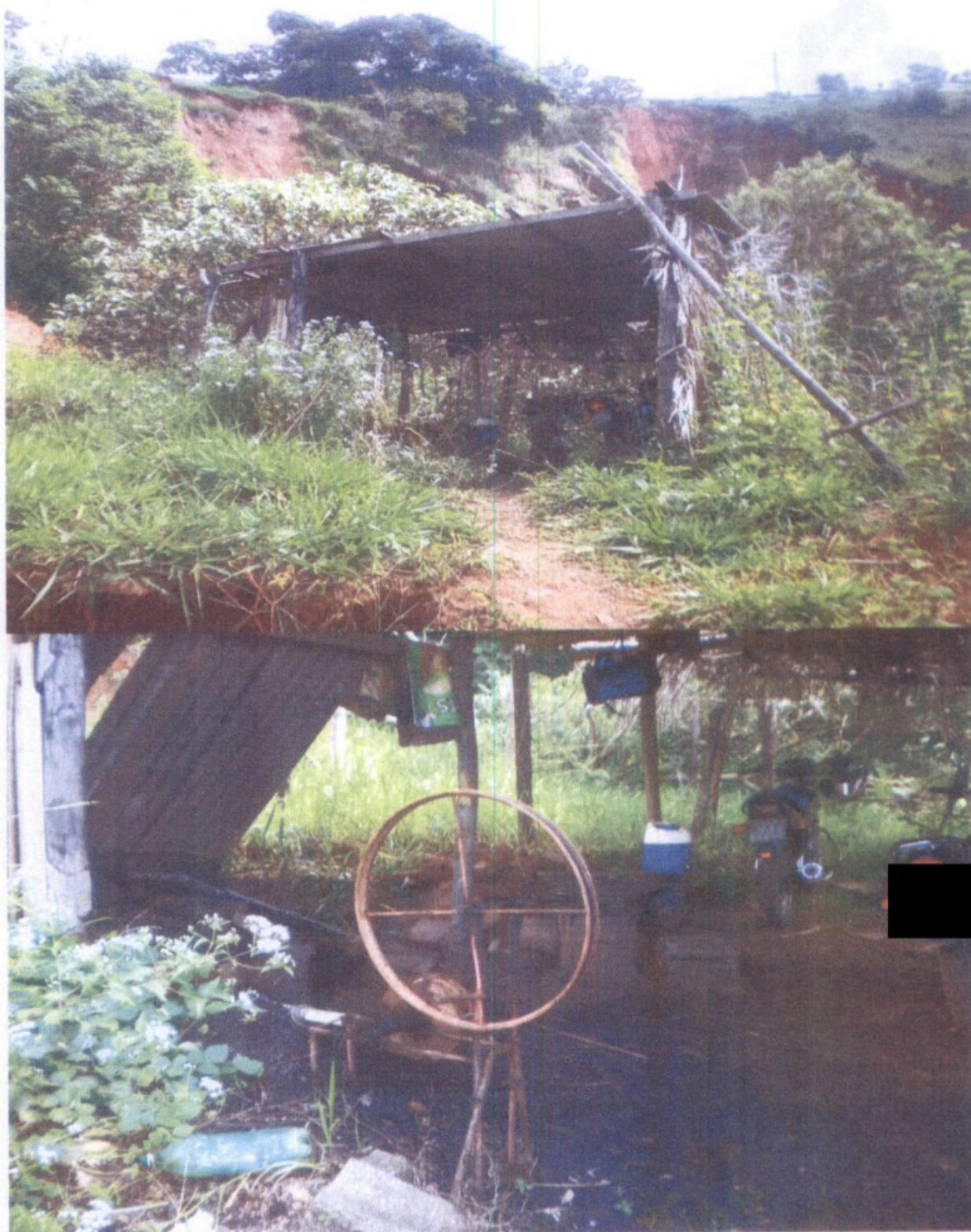
Edificação improvisada para o abrigo do sol, chuva e realização das refeições