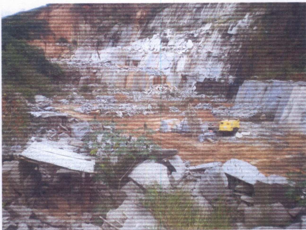
Área de exploração da retirada da pedra pelo empregador

Em relação ao ambiente de trabalho na área de extração de pedra bruta, a fiscalização encontrou irregularidades, a seguir listadas.