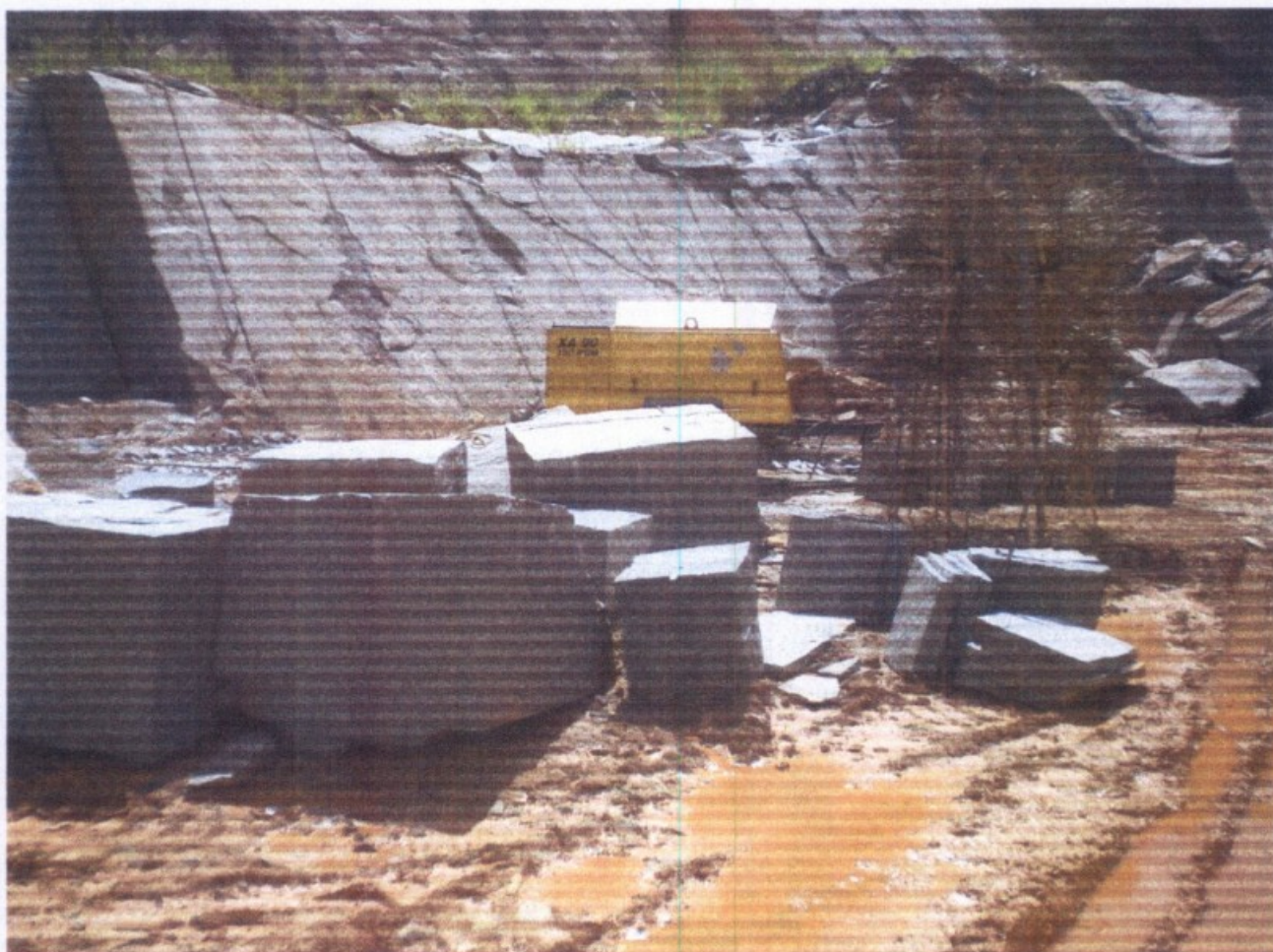
Área interdita pela fiscalização na extração de pedras do empregador