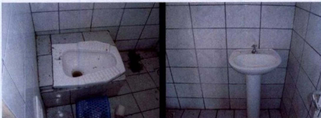
Instalações desocupadas, mas em boas condições de uso.

No dia 05/05, na cidade de Araguaína, parte da Equipe de Fiscalização foi até o escritório de contabilidade dos senhor [REDACTED] que atende o empregador. Lá foram conferidos os registros e outros documentos dos empregados que foram encontrados na fazenda.