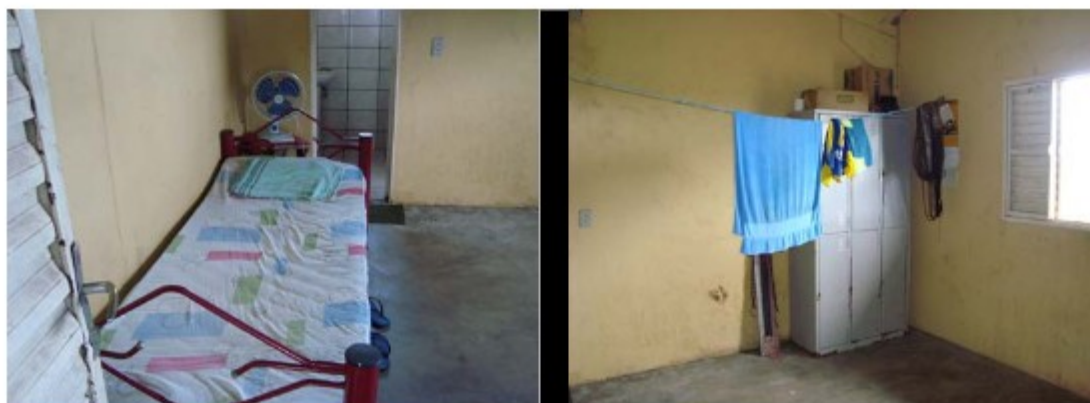
Um dos cômodos que estavam ocupados à época da inspeção.

Apesar de a propriedade ser de grande porte, haviam poucos empregados em atividade devido ao período de chuvas. No entanto, verificou-se que as instalações preparadas para receberem os empregados naquelas épocas em que as atividades se intensificam estavam de acordo com as prescrições normativas.