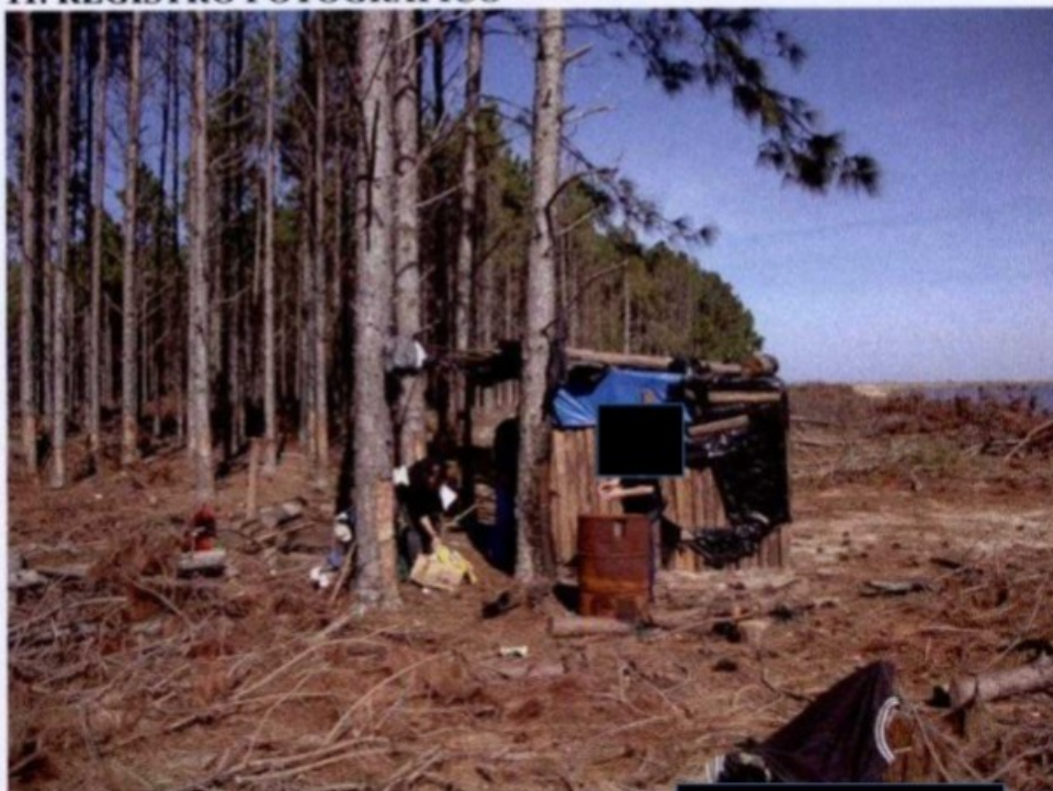
Alojamento encontrado na frente de trabalho de [REDACTED]