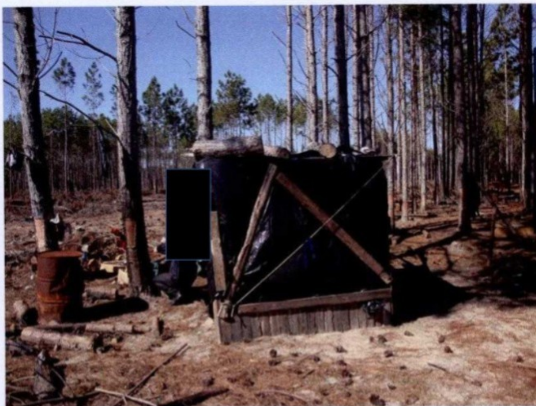
O alojamento não possuía condições sanitárias e higiênicas