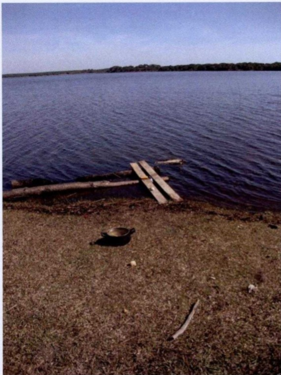
Lago onde trabalhadores lavavam louça, roupa e do qual tiravam água para consumo