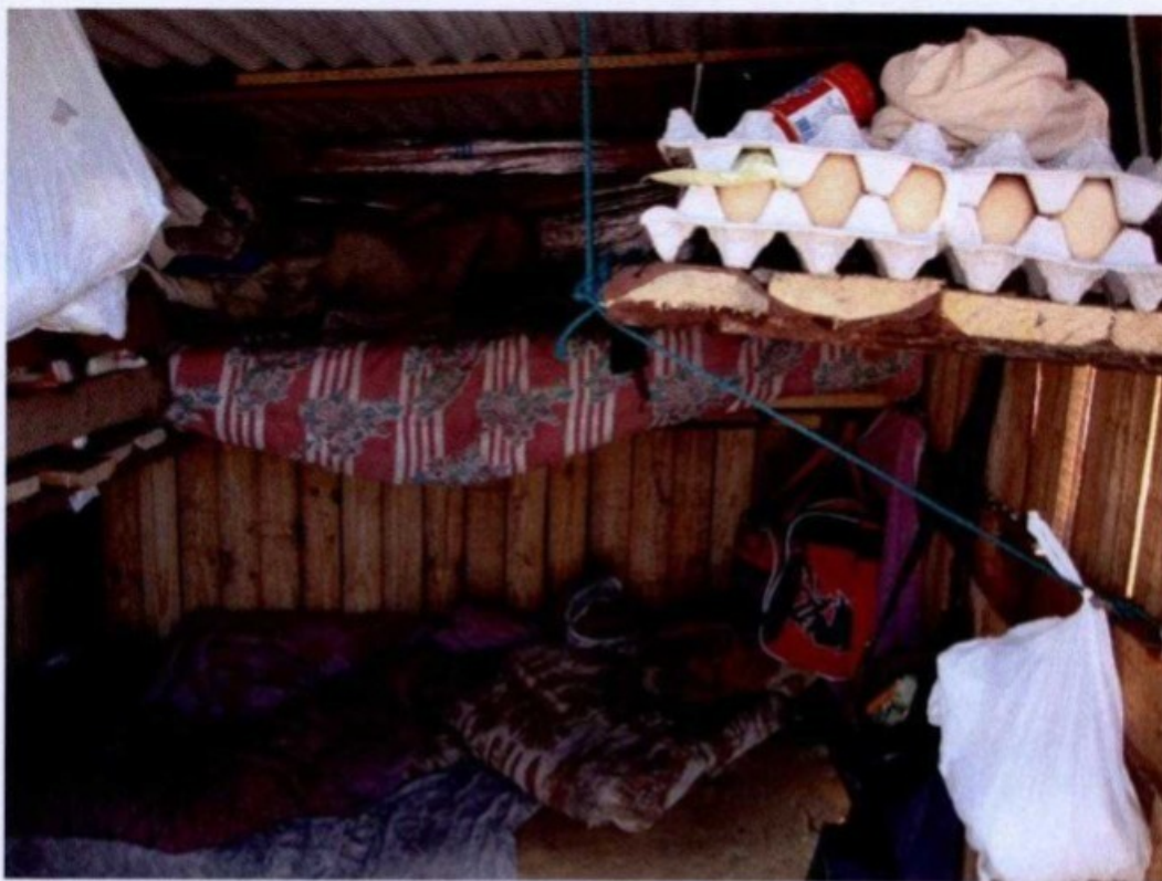
Alimentos eram acondicionados ao lado das camas