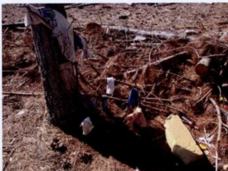
Roupas e pertences dos empregados espalhados pelo chão