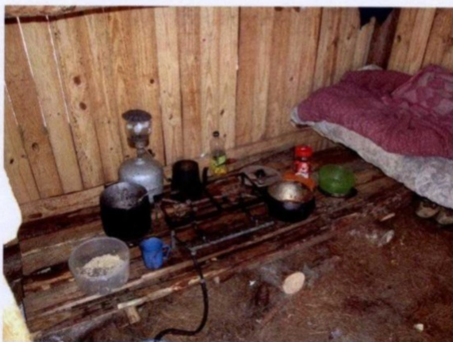
Comida era preparada dentro do alojamento