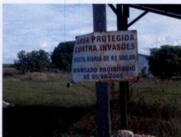
Placa de advertência

O GEFM inspecionou as dependências da fazenda, tais como frente de trabalho, alojamentos (que se encontravam abandonados), galpão para armazenamento de adubo, além de entrevistar o único trabalhador encontrado e, em suma, não foi constatada a sujeição de trabalhador à condição análoga à de escravo.