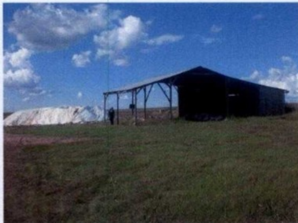
Instalação da fazenda: estoque de adubo

O empregador foi notificado a apresentar os documentos necessários à verificação do cumprimento das normas trabalhistas na Gerência Regional do Trabalho em Rondonópolis-MT, no dia 3 de junho de 2009, ocasião em que não foram constadas irregularidades.