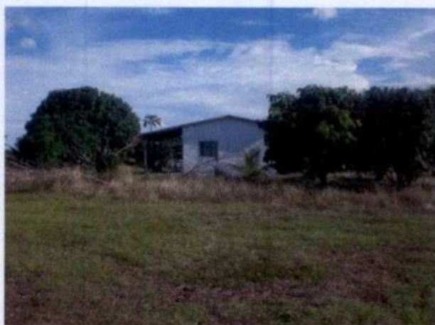
Sede abandonada da fazenda

No dia 28 de maio de 2009, o GEFM iniciou ação fiscal de monitoramento na Fazenda Liberdade, a fim de verificar a possibilidade de reincidência em sujeitar trabalhadores à condição análoga à de escravo.