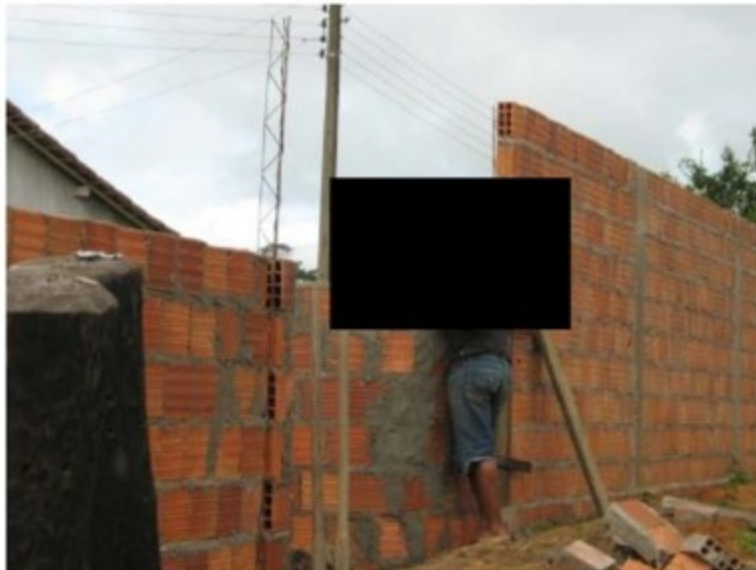
empregados registrados sob ação fiscal

Foram lavrados 02 (dois) autos de infração. Dois trabalhadores foram resgatados da condição de degradância, pelo Grupo de Erradicação do Trabalho Escravo, naquela ocasião e, posteriormente, a propriedade foi incluída no Cadastro de Empregadores, previsto na aludida Portaria 540/04.