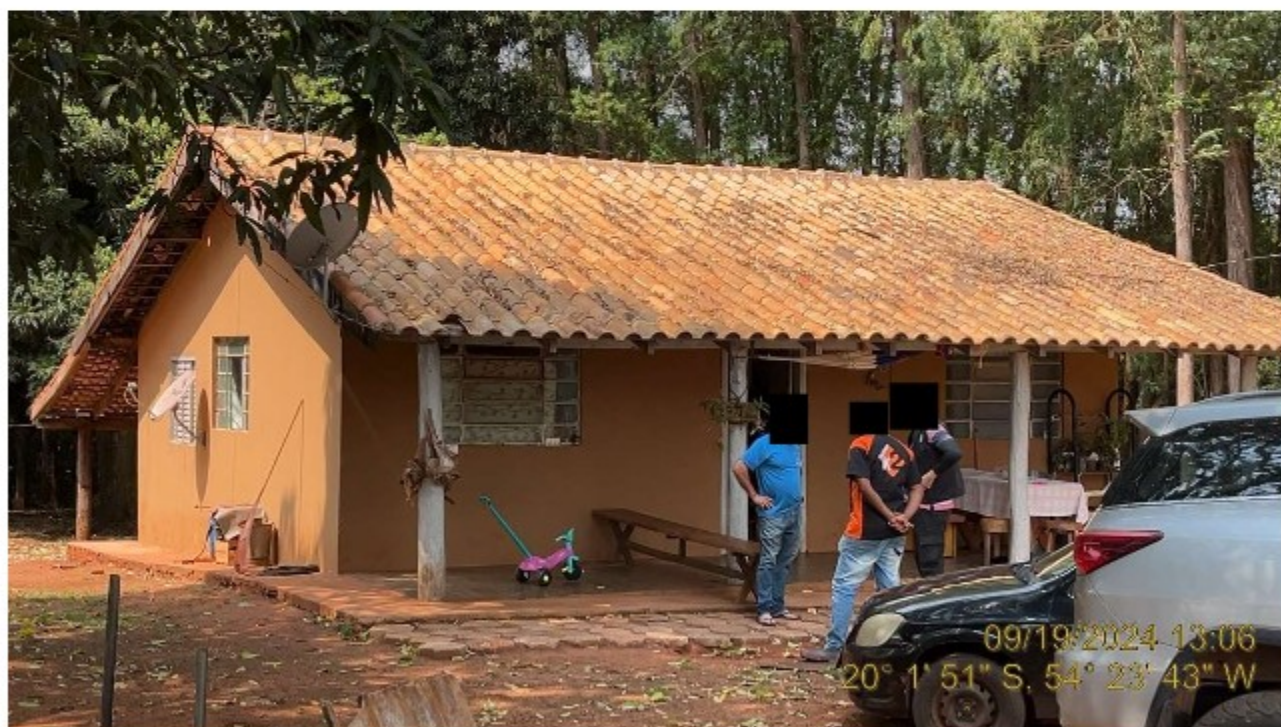
Imagem 07: Moradia Familiar Utilizada por Trabalhador com Atividade na Leiteria da Propriedade