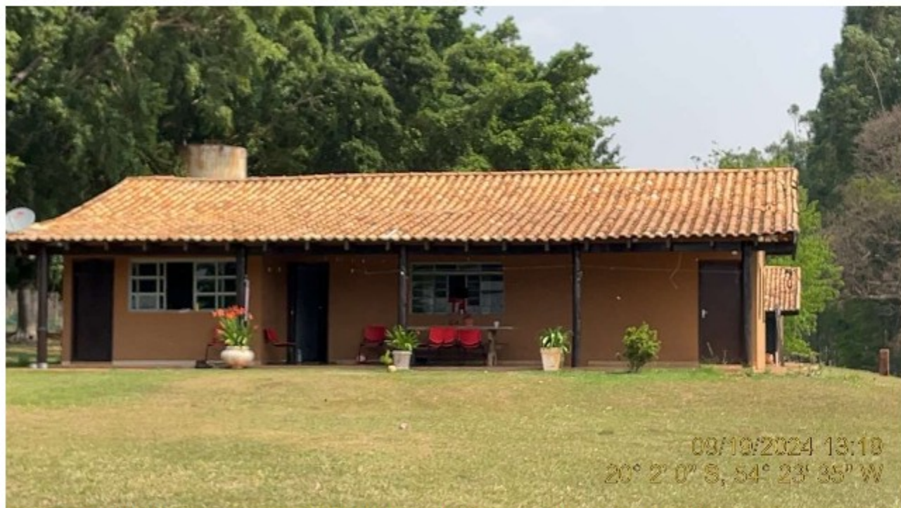
Imagem 09: Moradia Familiar Utilizada pelo Gerente da Propriedade