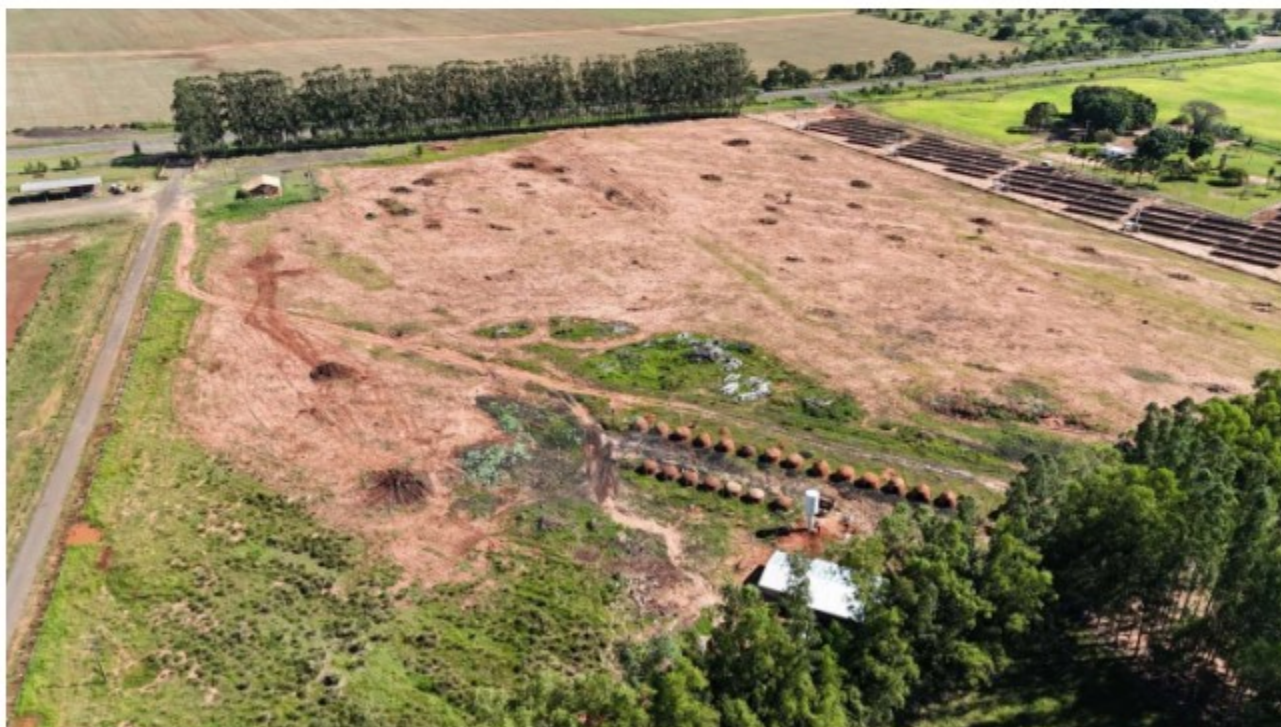
Imagem 01: Vista aérea da área da carvoaria, com visualização da Rodovia BR 163, ao fundo - 03/05/2024

Nessa data, não realizamos inspeção trabalhista na propriedade, em razão da não confirmação de atividade laboral na carvoaria. No entanto, registramos as imagens obtidas na ocasião: