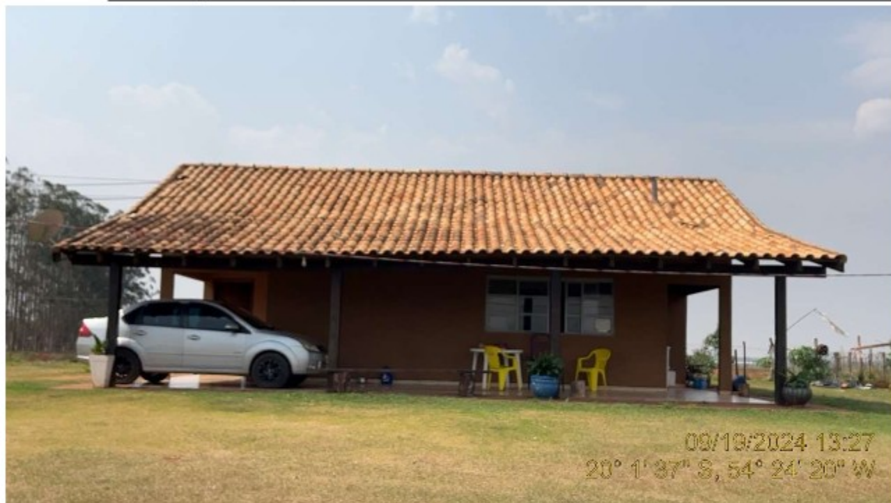
Imagem 10: Moradia Familiar Utilizada pelo Trabalhador da Portaria

Desta forma, após as diligências realizadas na FAZENDA K2, JARAGUARI, MS, no dia 19/09/2024, com inspeção do local de edificação dos fornos de produção de carvão e nas áreas de vivência destinadas aos trabalhadores, não confirmamos a prática das irregularidades noticiadas via DISQUE DIREITOS HUMANOS - protocolo 2247946, em 12/12/2023.