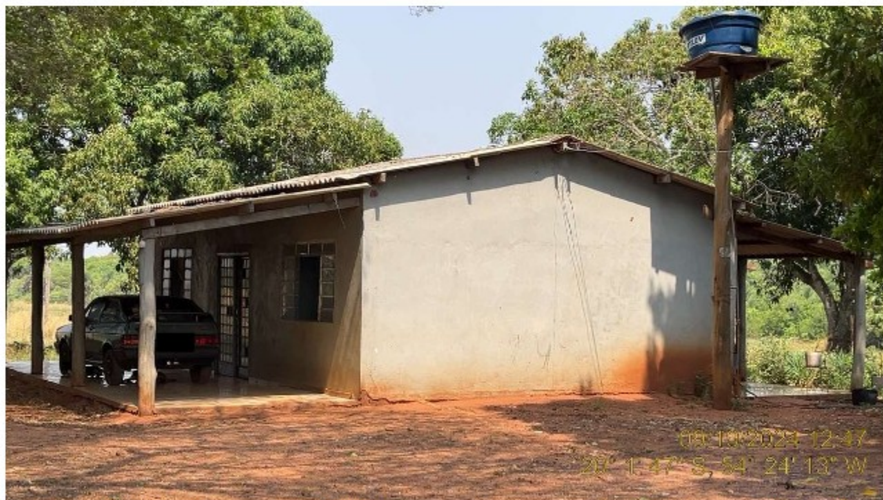
Imagem 05: Moradia Familiar Utilizada por Trabalhador com Atividade na Carvoaria