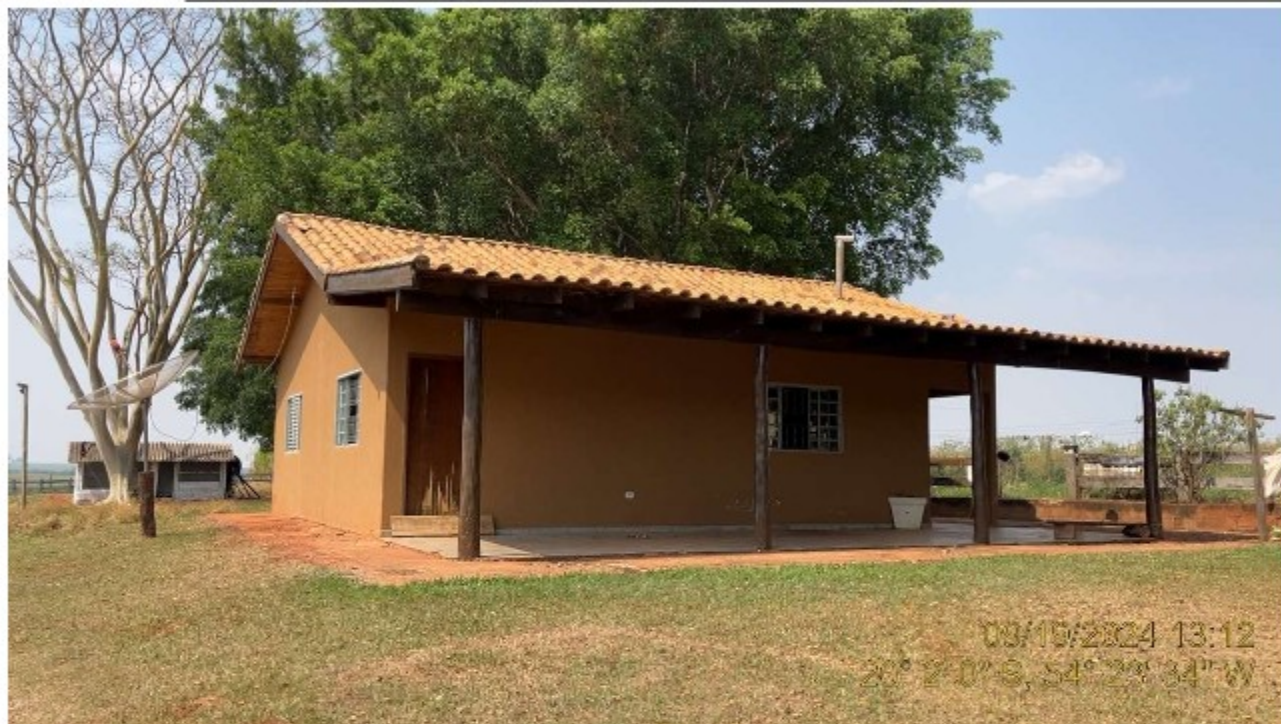
Imagem 08: Moradia Familiar Utilizada por Trabalhador dos Serviços Gerais