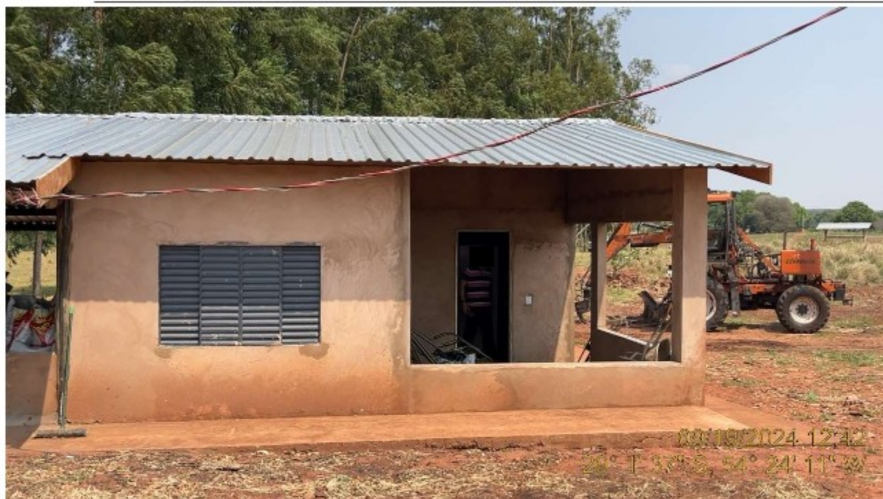
Imagem 04: Edificação de Apoio e Depósito de Carvão