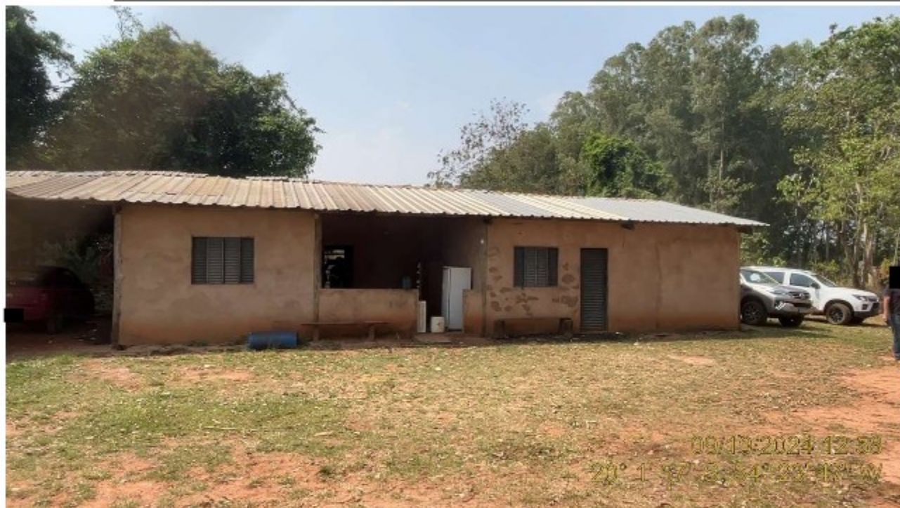
Imagem 06: Alojamento Utilizado por 1 (um) Trabalhador com Atividade na Carvoaria