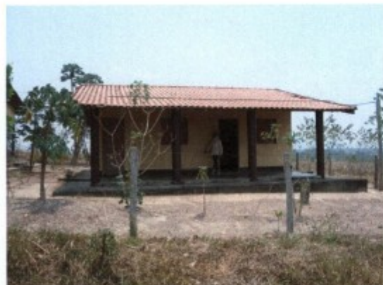
Moradias de retiro.