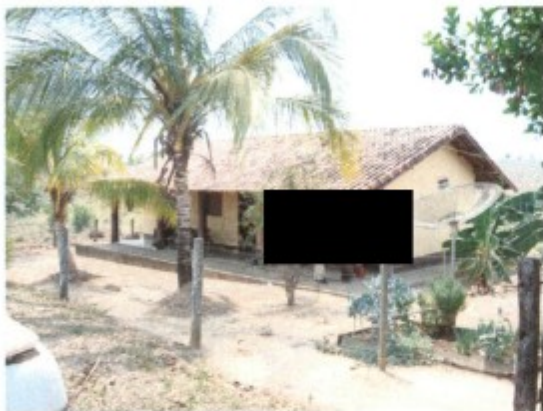
Moradias de retiro.