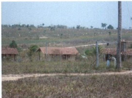
Moradias e casa sede (dir.).