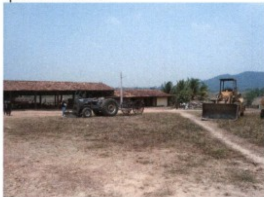
Edificações da área da sede da fazenda.

A área da casa sede, servia também à administração da fazenda Barra do Pará, de propriedade dos filhos do Sr. [REDAZIDA] (a saber, [REDAZIDA] e com a qual é lindante.