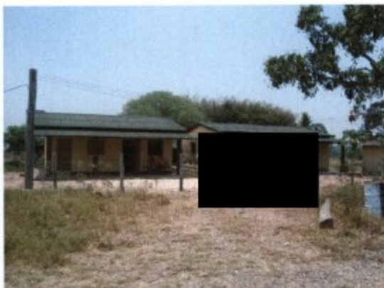
Moradias na entrada da fazenda.

Não havia casa sede, visto que a fazenda Barra do Pará era administrada em conjunto com a fazenda Nossa Senhora do Carmo, de propriedade de [REDACTED] genitor de [REDACTED] e este empregador utilizava como sede edificação situada na fazenda Nossa Senhora do Carmo, lindante com a fazenda Barra do Pará.