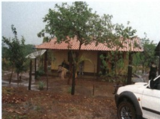
Moradia de um dos retiros.