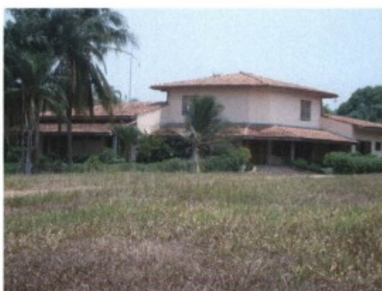
Casa sede localizada na fazenda N.S. do Carmo, lindante com a fazenda Barra do Pará.

Na fazenda foram encontrados em atividade 17 trabalhadores.