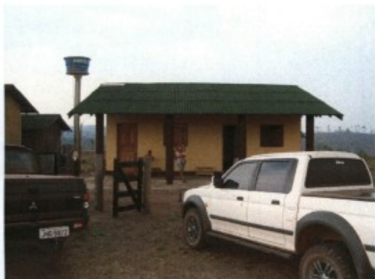
Moradia de outro retiro.