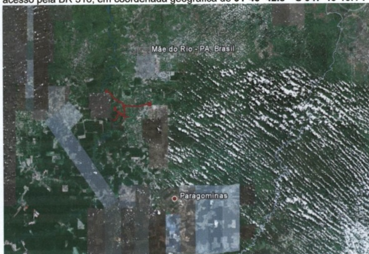
Área do projeto de plantação de Amapá, com acesso pelo km 240 da BR 010 – km 32 do ramal 81-, em coordenada geográfica abaixo descrita: