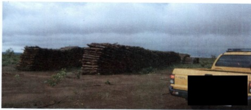
Foto de pilha de eucalipto cortado, pelo estado apresentado, conclui – se a madeira já havia sido cortada a vários dias, pois estava extremamente seca.

Inquirido sobre os trabalhadores que desenvolviam a atividade de corte de eucaliptos (alvo da denúncia), informou – nos que os mesmos já não se encontravam na propriedade e que, na cidade de Barra do Garças corria um processo na justiça do trabalho, referente a relação havida entre a fazenda e a pessoa (firma), que lhe havia comprado um volume de madeira, para venda como lenha; que a fazenda possuía um contrato puramente mercantil com a compradora, que no contrato estava estipulado que a fazenda, receberia R$45,00 (quarenta e cinco reais) pelo metro cúbico de eucalipto, cabendo a compradora a responsabilidade pela extração e transporte da madeira; informou – nos ainda que os trabalhadores faziam parte do pólo reclamante e que a primeira audiência já havia ocorrido.