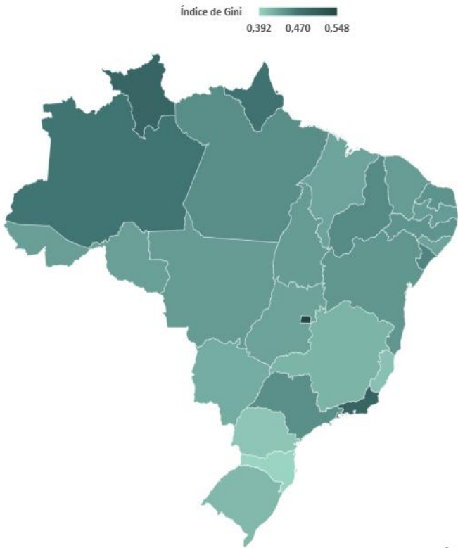
Figura 2. Brasil: Índice de Gini da RAIS

Entre as 27 Unidades da Federação, 20 registraram um Índice de Gini abaixo da média nacional, com destaque para o Santa Catarina (0,392) e Paraná (0,404). Por outro lado, 7 Unidades da Federação que apresentaram um Índice de Gini acima da média geral, principalmente o Distrito Federal (0,548) e o Rio de Janeiro (0,495).