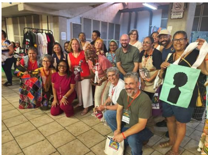
Expositores/as da Feira de Economia Solidária, durante encontro

A Secretaria Nacional de Economia Popular e Solidária (Senaes) marcou presença no 13º Encontro Nacional de Fé e Política, entre os dias 24 a 26 de abril, no Ginásio Poliesportivo de São Bernardo do Campo. O evento reuniu lideranças religiosas de diversas matrizes, movimentos sociais e o Movimento Nacional Fé e Política, promotor da atividade, além de coletivos populares e movimentos de base.