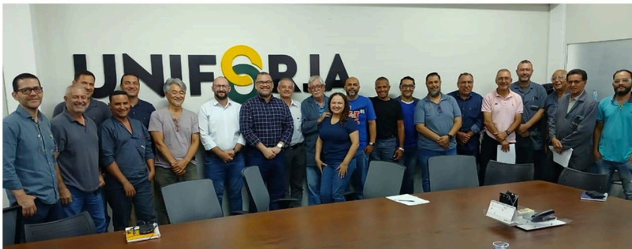
Encontro ocorreu no dia 24 de abril na Uniforja, em Diadema, SP