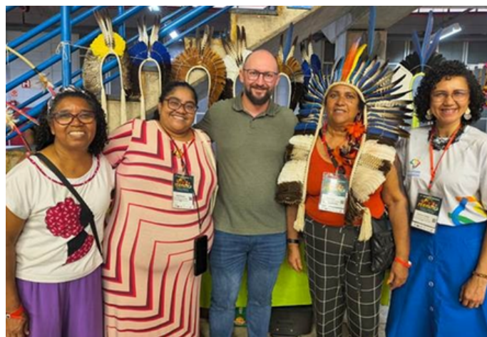
Secretário nacional: diálogo com mulheres indígenas e das comunidades tradicionais