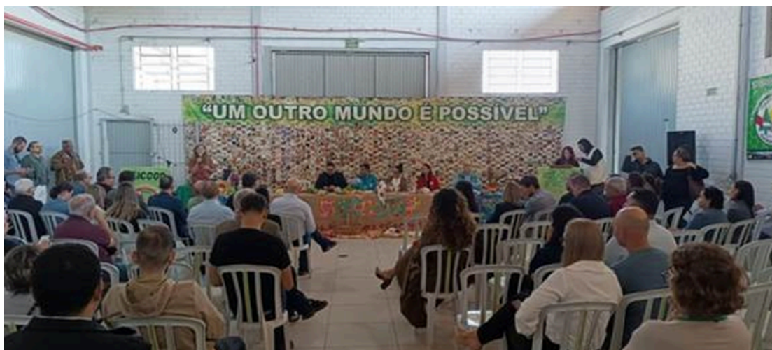
Ato de lançamento da 32ª Feicoop

O ato de lançamento da 32ª Feira Internacional do Cooperativismo e da Economia Solidária (Feicoop) foi realizado em Santa Maria, no dia 11 de abril, no Centro de Referência em Economia Solidária Dom Ivo Lorscheiter, anunciando o evento para julho.