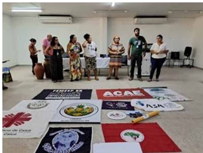
Equipe do Paul Singer, agentes e coordenadores no evento

O Programa Paul Singer também ganhou espaço quando a Equipe de Coordenadores Estaduais e agentes territoriais de Economia Popular e Solidária apresentaram a estrutura do programa e os territórios e empreendimentos atendidos no estado.