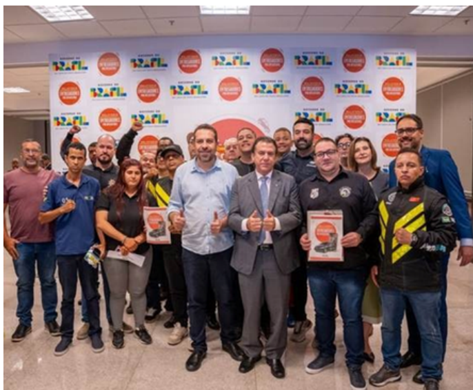
Ministros e Entregadores por Aplicativo na entrega do Relatório Final

Já está disponível, no site da Secretaria-Geral da Presidência da República, o Relatório Final do Grupo de Trabalho Técnico (GTT) Interministerial de Entregadores por Aplicativo, que foi apresentado à sociedade, no dia 24 de março, no Centro Internacional de Convenções do Brasil (CICB), em Brasília. O documento traz um conjunto de medidas para melhorar a vida do segmento que atua com entrega sobre duas rodas.