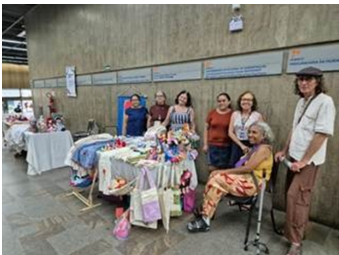
A atividade foi realizada no dia 10/03