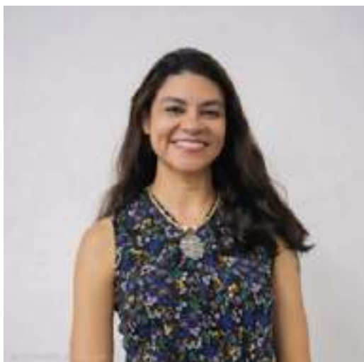
Coordenadora do curso

Com este curso, a Fundacentro dá continuidade às formações realizadas em 2024 e 2025, sobre "Ergonomia no enfrentamento dos fatores psicossociais do trabalho".