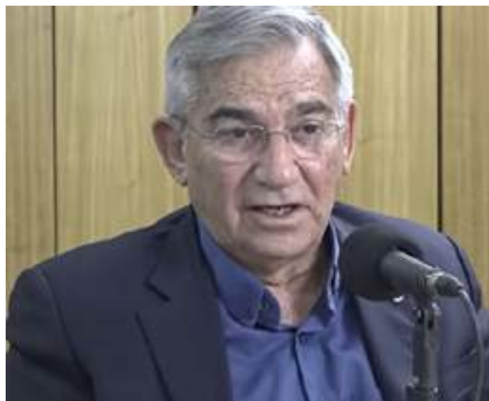
Carvalho: território, espaço de luta

Com perguntas direcionadas aos dois convidados, o encontro permitiu esclarecimentos sobre o que é um território para as políticas públicas, quais são os resultados e acúmulos com a escuta dos territórios, como o Governo vê o território e qual é o papel do agente na implementação das políticas públicas? E, por fim, como deve ser a ação do agente nos territórios?