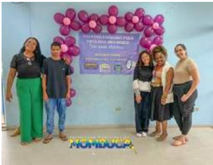
Atividades em Mombuca/SP, em 09/03: “não somos estatísticas”.