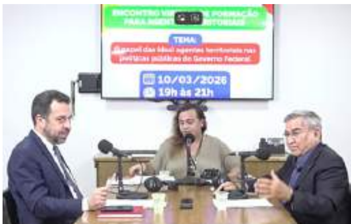
Evento organizado pela SG-PR

Live com agentes territoriais também teve a participação do secretário nacional de Economia Popular e Solidária.