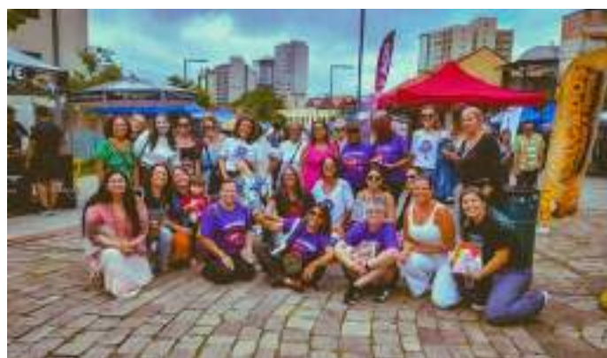
Chay Luge – Com o mote nacional e unificado “Pela vida das mulheres! Contra o imperialismo, por democracia, soberania e pelo fim da escala 6x1!”, a Marcha Mundial das Mulheres (MMM) e outras organizações e movimentos sociais ocuparam as ruas de todo o Brasil no 8 de março de 2026. A Marcha em Porto Alegre.