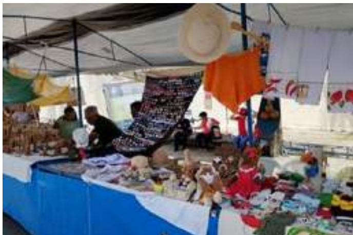
Feira de Economia Solidária, em São Cristóvão (SE)

As atividades do Programa Governo do Brasil na Rua, na última quinta-feira, dia 12/03, na Escola Glorita Portugal, no bairro Rosa Elze, em São Cristóvão, município próximo de Aracaju, em Sergipe, contaram com a participação de empreendimentos de Economia Popular e Solidária, que participaram de uma Feira de Economia Solidária, dentro da ação governamental.