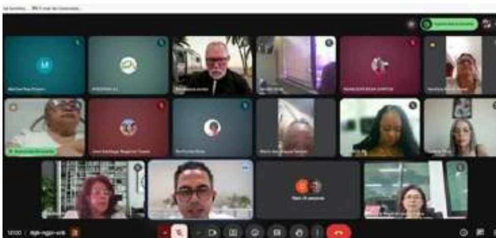
Formação com membros das Comissões