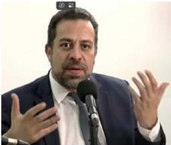
Boulos: novos encontros anunciados