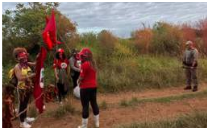
Em São Gabriel, 500 mulheres do Movimento dos Trabalhadores Sem Terra ocuparam no dia 09/03, uma área de aproximadamente 400 hectares da Fepagro. A ação integrou a Jornada Nacional de Luta das Mulheres Sem Terra, realizada entre os dias 8 e 12 de março, com o lema: “Reforma Agrária Popular: enfrentar as violências, ocupar e organizar!”. A mobilização também levantou pautas como o combate ao feminicídio, igualdade salarial, valorização da Política Nacional do Cuidado e melhores condições de vida para as mulheres.