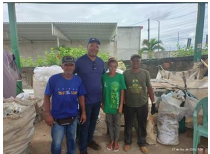
Equipe de catadores/as na Associação dos Catadores de Inhambupe (BA)

“Acho que fui o primeiro catador do Brasil a ocupar um cargo desta envergadura. Lá, neste município, nasceu a Associação dos Catadores de Inhambupe, em 2013, são 15 associados, com uma boa infraestrutura, com galpões enormes, prensas e vão chegar, em breve, caminhões e mais equipamentos”.