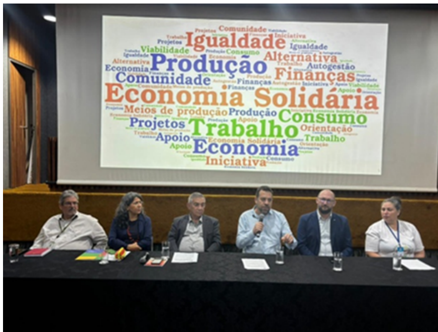
Mesa de abertura da Reunião do Conselho

O Conselho Nacional de Economia Popular e Solidária realizou sua primeira reunião ordinária, presencial, em Brasília nos dias 26 e 27 de fevereiro, no Bloco F da Esplanada dos Ministérios.