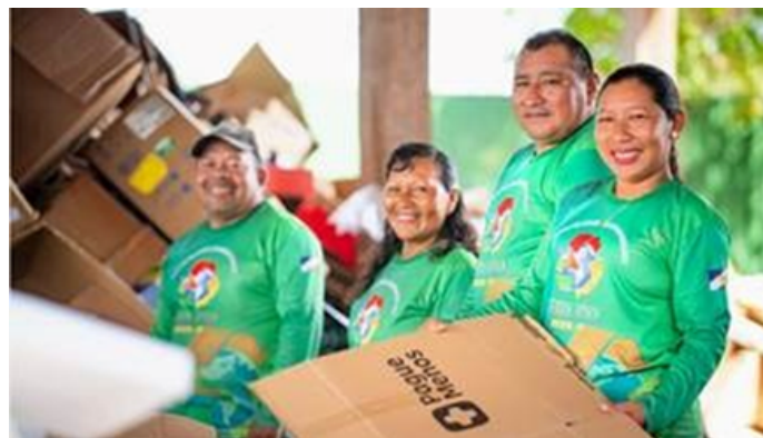
Catadores de Materiais Recicláveis da Associação Terra Viva

Segundo a catadora, as barreiras e dificuldades motivam cada vez mais para que o trabalho seja realizado. “Esse trabalho é que nos garante a nossa renda. Somos 22 catadores atuando ativamente. Somos catadores com muito orgulho, nas dificuldades e nas vitórias. Somos uma família”, afirma.