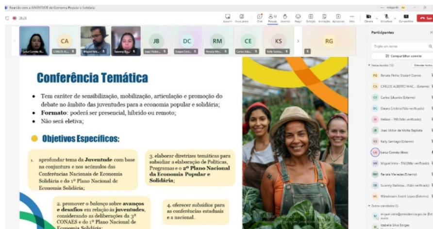
Reunião da Juventude em 25/09

Apesar de ainda não ter uma data específica para a realização da Conferência Temática de Juventude e Economia Popular e Solidária, a mobilização e a articulação com os movimentos segue a pleno vapor.