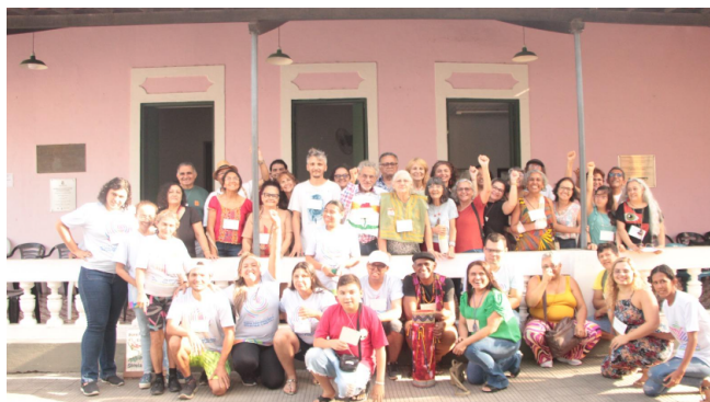
1ª Conferência Livre de Cultura em Economia Popular e Solidária/CE

Confira o calendário das próximas conferências livres e temáticas: