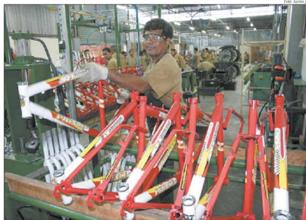
Indústria recupera nível de produção não registrado há quatro anos no PIM

O dirigente, que também é vice-presidente da Fieam, acres-