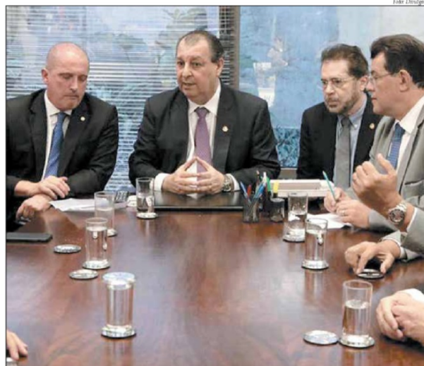
Bancada do Amazonas apresentou uma série de demandas ao ministro Onyx Lorenzoni

De acordo com o senador, Onyx prometeu também dar em duas semanas uma posição sobre a prorrogação dos incentivos fiscais dos PPBs (Processos Produtivos Básicos) para