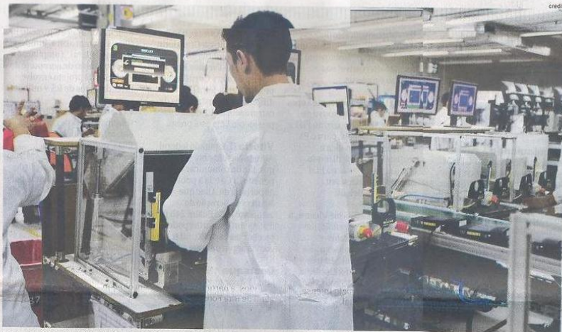
As empresas de informática instaladas no Polo Industrial da Zona Franca de Manaus serão beneficiadas com a aprovação da Medida Provisória 810/2017

A medida provisória precisa ser votada até 25 de maio pelos Plenários da Câmara e do Senado ou perderá a validade. A MP atualiza duas leis de 1991 (8.248 e 8.387) que regulamentam o setor de tecnologia da informação e comunicação. As duas leis concedem incentivos fiscais para empresas do setor de tecnologia, como a redução ou isenção do Imposto sobre Produtos Industrializados (IPI), além de vantagens na contratação pela administração pública. Em contrapartida, as empresas devem investir, pelo menos, 5% em pesquisa e desenvolvimento e com-