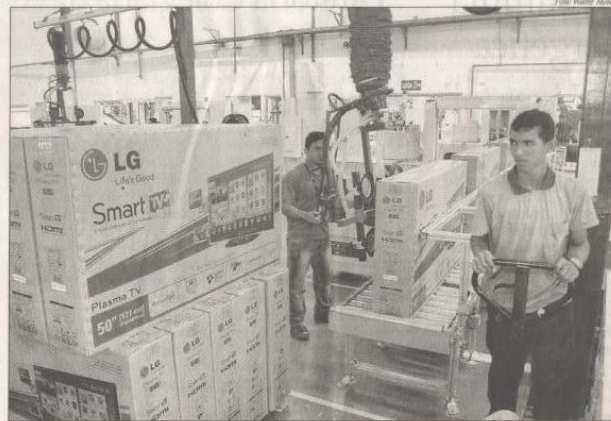
Expectativa do setor é que os jogos da copa do mundo estimulem a produção de televisores

Segundo o IBGE, a produção industrial amazônica recuou