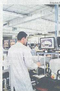
Oito estados registraram baixas

Na comparação com fevereiro do ano passado, a indústria cresceu em nove locais, com destaque para o Amazonas (16,2%), e caiu em seis. Os maio-