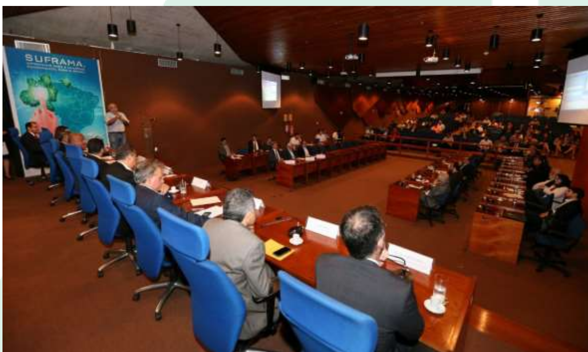
Reunião registrou os 51 anos de criação da SUFRAMA e da Zona Franca de Manaus