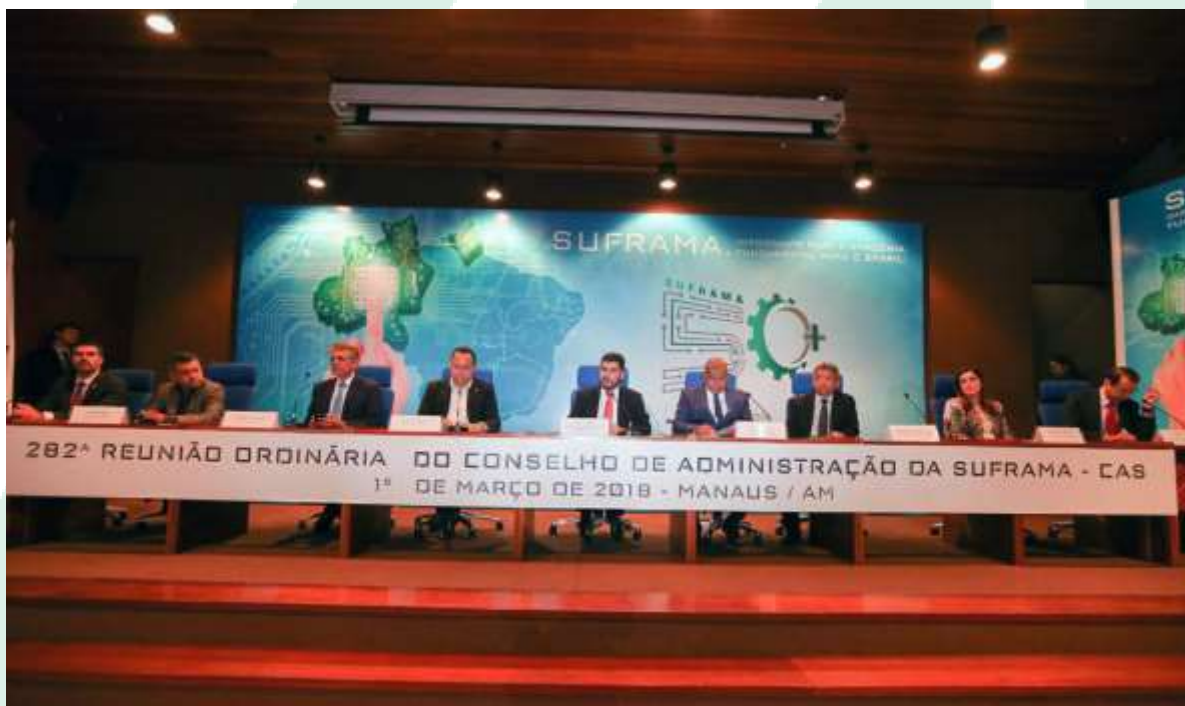
252ª Reunião Ordinária do CAS, realizada em Manaus, no auditório da sede da SUFRAMA