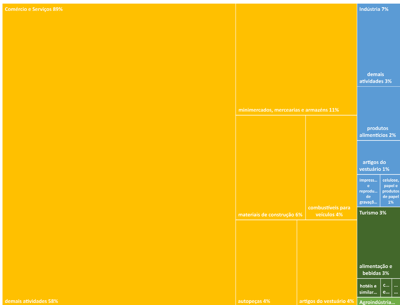
Gráfico 3 - PI - FNE Linha Emergencial 2020 (abril-junho): Distribuição por Setor e por Atividade Econômica