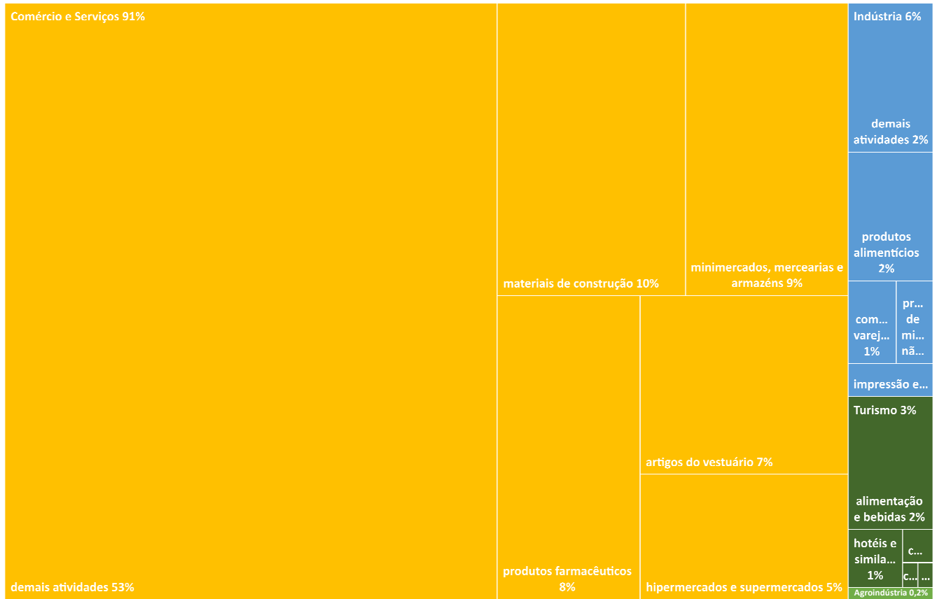
Gráfico 3 - MG - FNE Linha Emergencial 2020 (abril-junho): Distribuição por Setor e por Atividade Econômica