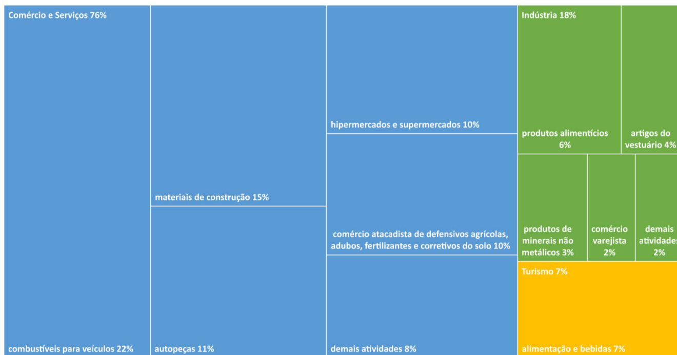
Gráfico 3 - ES - FNE Linha Emergencial 2020 (abril-maio): Distribuição por Setor e por Atividade Econômica

As contratações no setor de Turismo foram alocadas em 1 grupo de atividade econômica (CNAE): alimentação e bebidas (R$ 308,5 mil).