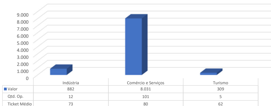
Gráfico 2 - ES - FNE Linha Emergencial 2020 (abril-maio): Distribuição por Setor

As contratações no setor da Indústria foram alocadas em 6 divisões de atividades econômicas (CNAE), distribuídas da seguinte forma: produtos alimentícios (R$ 298,0 mil), artigos do vestuário (R$ 178,7 mil), produtos de minerais não metálicos (R$ 145,4 mil), comércio varejista (R$ 100,0 mil) e demais atividades (R$ 100,0 mil).